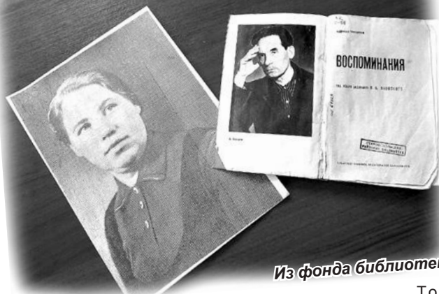
Из фонда библиотеки.