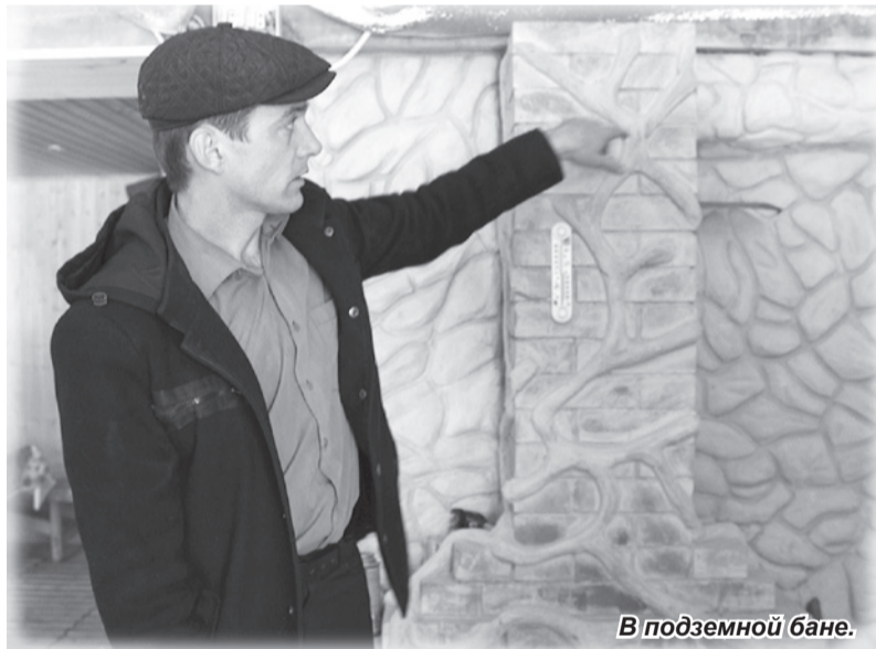
В подземной бане.