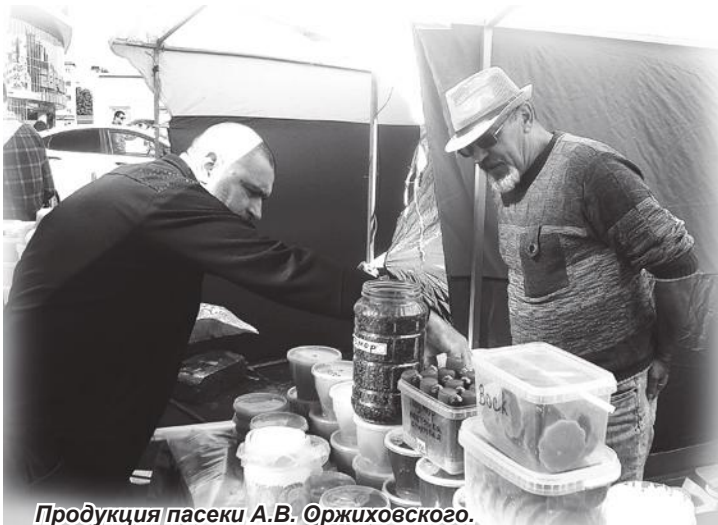
Продукция пасеки А.В. Оржиховского.