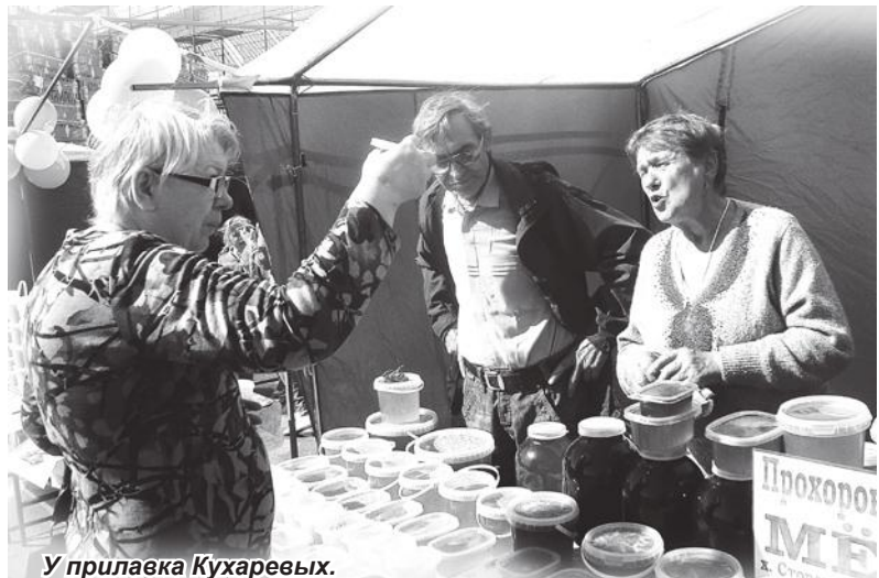
У прилавка Кухаревых.