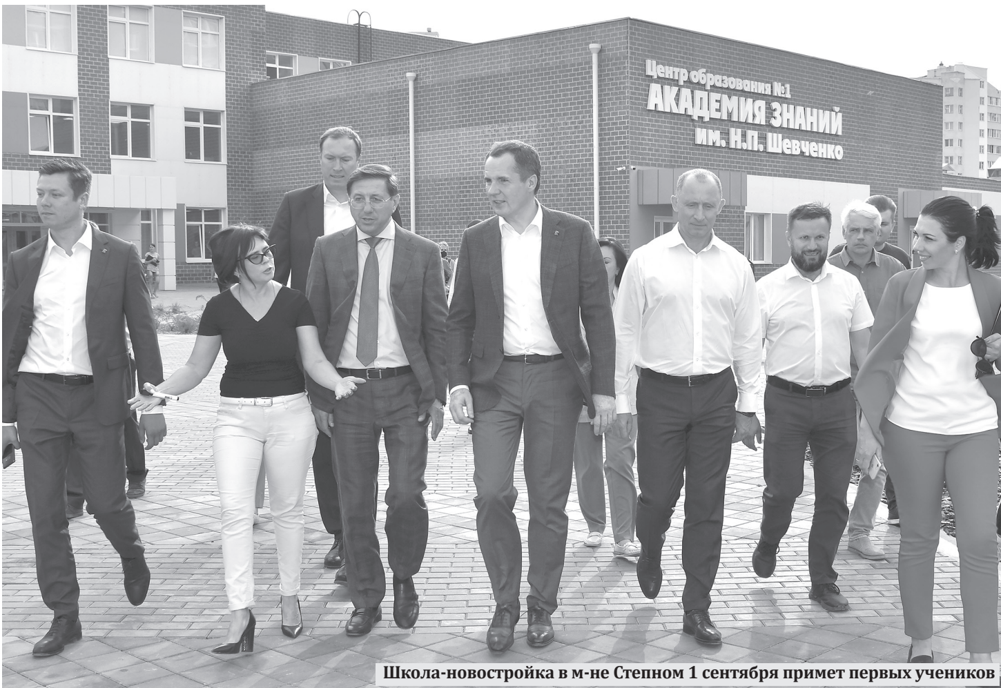
Школа-новостройка в м-не Степном 1 сентября примет первых учеников