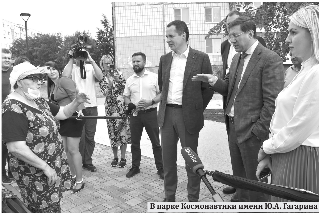
В парке Космонавтики имени Ю.А. Гагарина