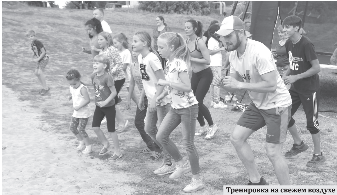
Тренировка на свежем воздухе

В Лапыгино 25 августа прошёл яркий праздник «Всё в твоих руках», посвящённый открытию современной воркаут-площадки. Тематические фотозоны, мастер-классы, спортивно-развлекательная программа для детей, сладкий стол, блюда на костре и горячий чай из самовара на дровах подготовили жители ТОСа «Вишнёвый» для односельчан и гостей.