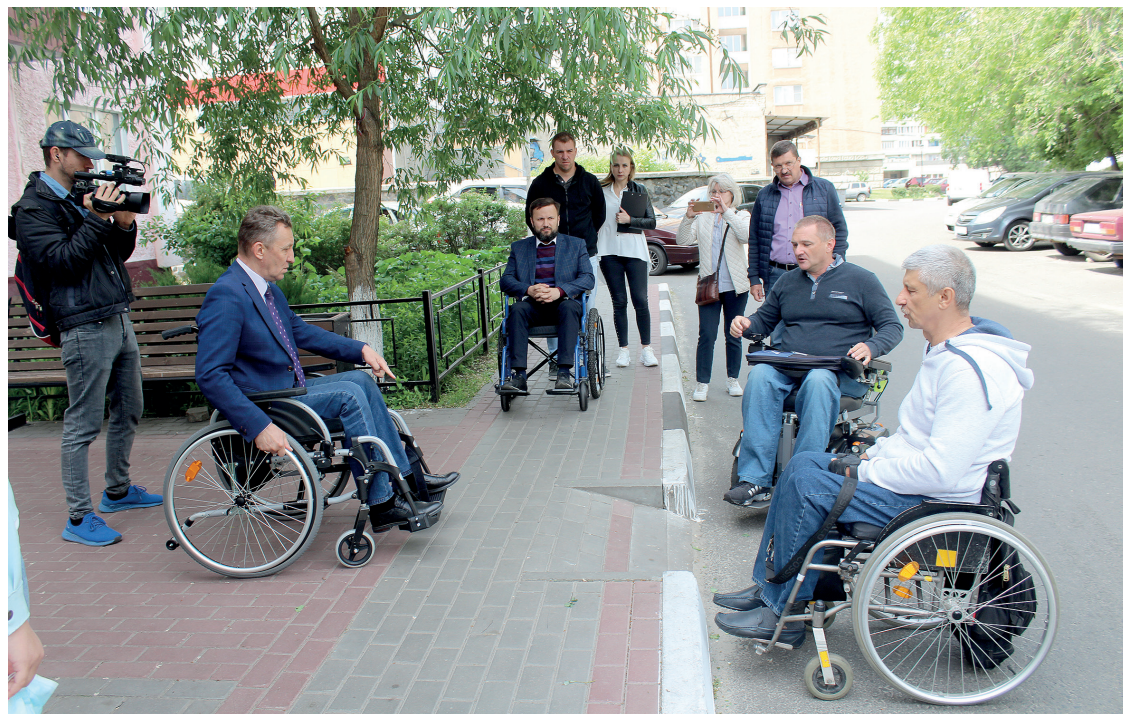
Пандусы на Жукова

Такая ситуация не только внутри кварталов. Инвалиды-