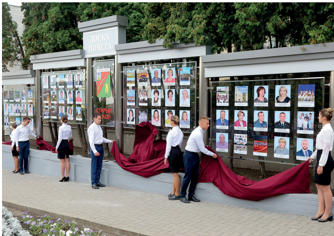
Открытие обновлённой Доски почёта

Гордимся прошлым, ценим настоящее и дорожим будущим