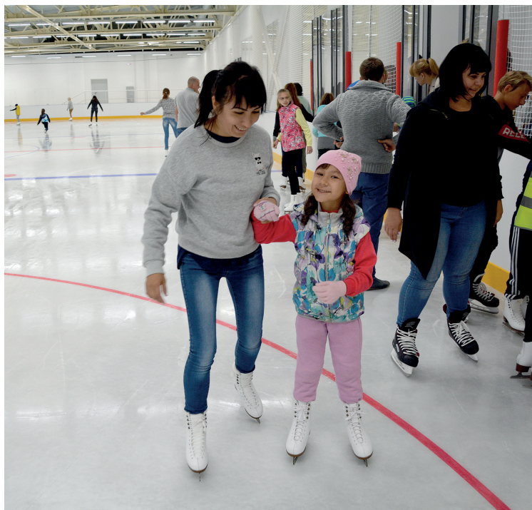
Первые шаги по новому льду