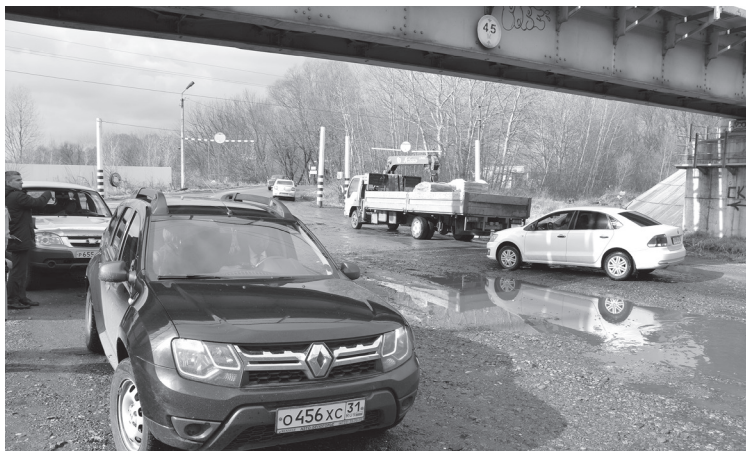
■ На улице Плотникова

Уже подготовлены контракты на будущее. В 2022 году будет выделено 200 млн рублей в рамках программы «Безопасные и качественные дороги».