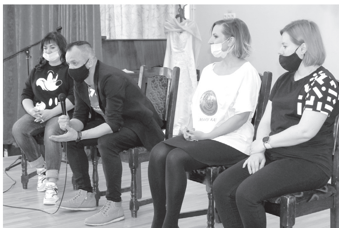
Специалисты рассказывают о своей работе

Волонтеры организовали для ребят сладкий стол, подарили девочкам духи и букеты цветов. Все, кто организовал детям праздник, – члены организации «Плечом к плечу», их добровольные помощники, профессионалы, принявшие в нём участие, – заслуживают огромной благодарности за помощь и поддержку, которую оказывают нуждающимся.