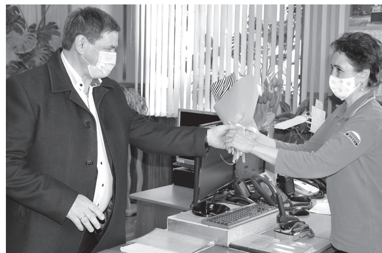
Цветы в Международный женский день