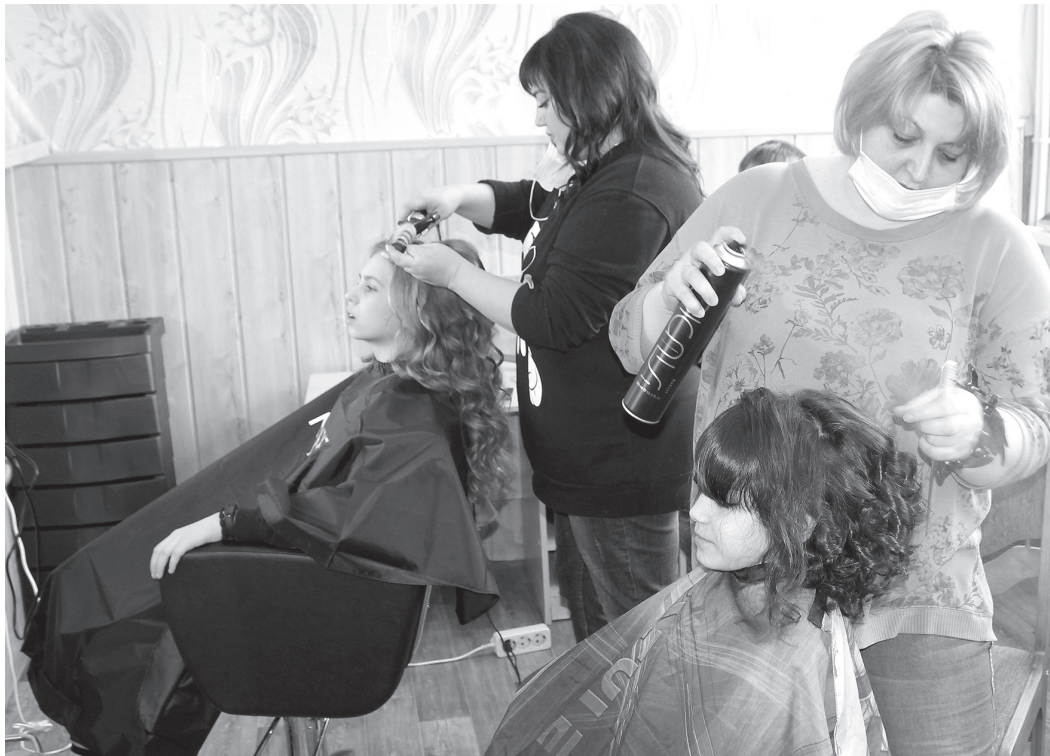
Мастера за работой

Седьмого марта детский дом посетили визажисты, бровисты и фотографы