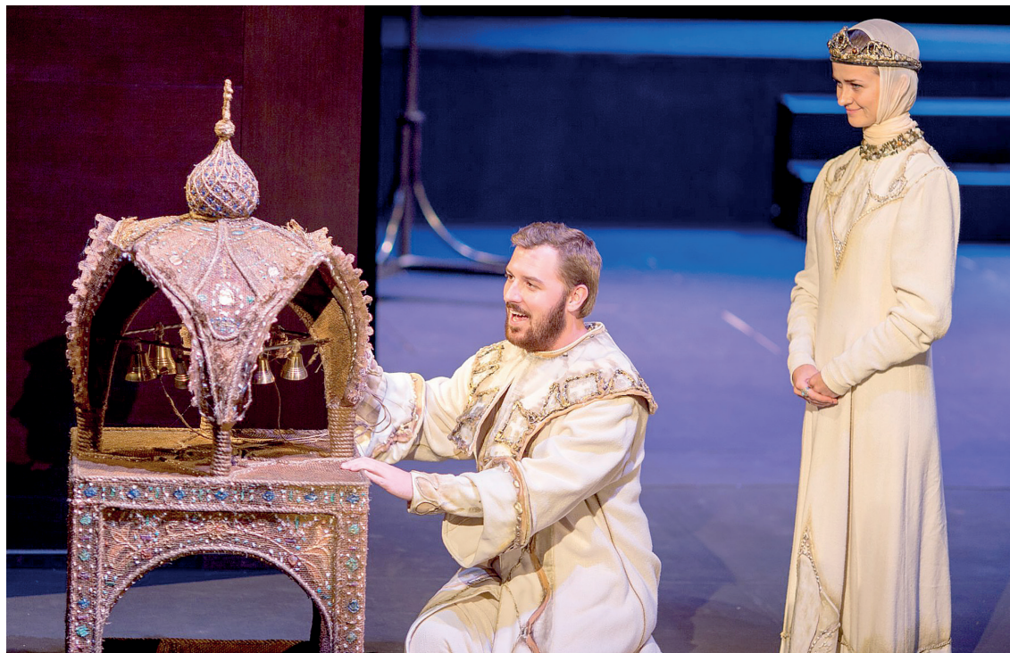
Сцена из спектакля «Царь Фёдор Иоаннович»