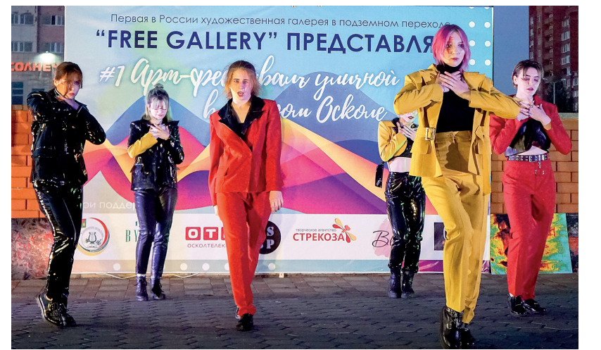
Корейский стиль от «Blackberry»

Однозначно можно сказать, что арт-фестиваль старооскольцам понравился. Организаторы планируют его повторить, а мы с нетерпением будем ждать нового путешествия в мир моды, стиля и творчества.