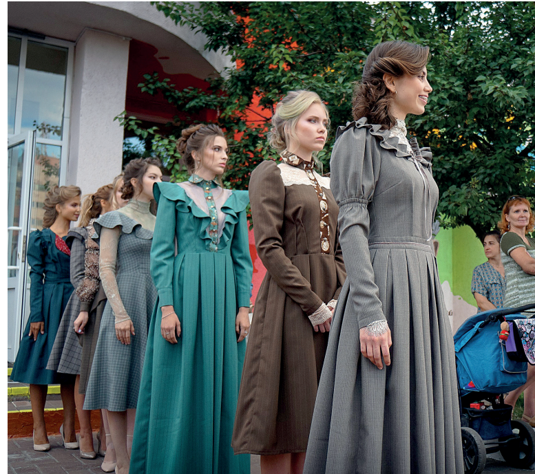
Тургеневские девушки Ану Каспер

Если ты создаёшь красоту своими руками, умеешь танцевать смело и дерзко, дружишь со спортом и выбираешь свой собственный стиль одежды, значит ты – в тренде. Это доказал арт-фестиваль уличной моды