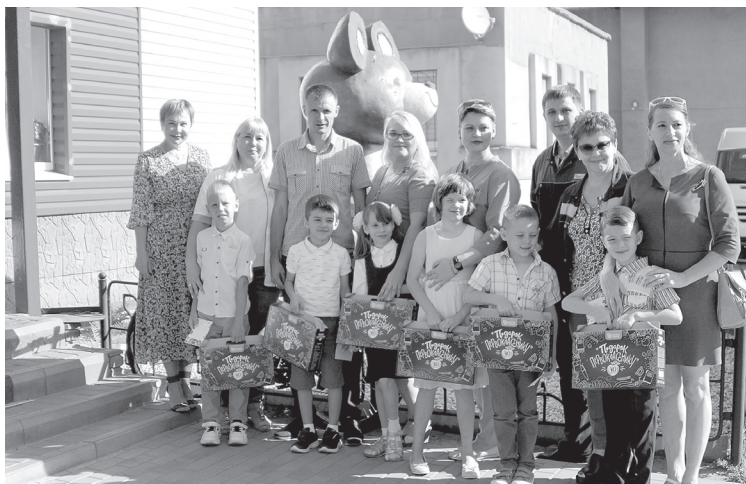
■ / ФОТО ОЛЬГИ ЗАПУННОЙ

Традиция дарить наборы детям членов профсоюза ОЭМК (это почти 90 % работников) существует с 2005 года. Обычно это делали в торжественной обстановке. В этом году из-за эпидемиологической ситуации решили – подарки разда-