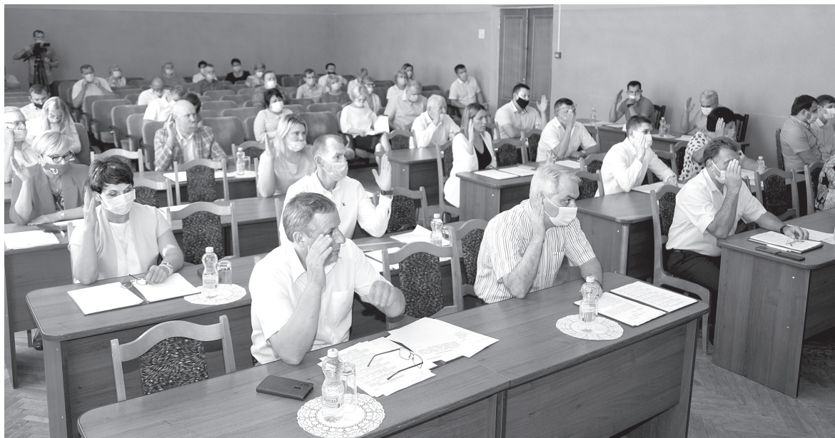
■ / ФОТО АЛЕКСАНДРА МИХАЙЛОВА

Большое внимание уделяется выполнению наказов избирателей. За последние два года их выполнено на общую сумму более 1 млрд 415 млн рублей. На 2020 год запланировано благоустройство дворовых территорий, ре-