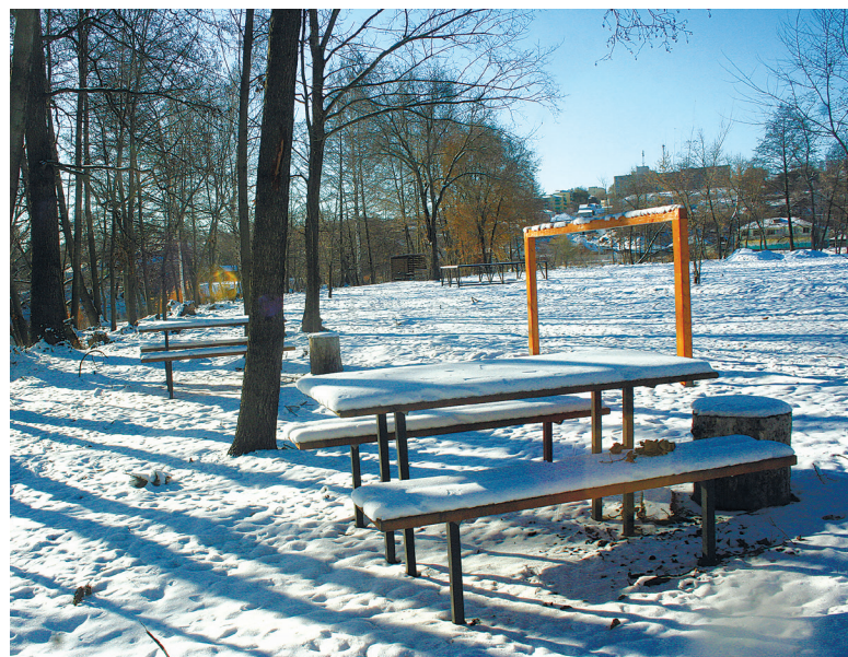
Будущее футбольное поле