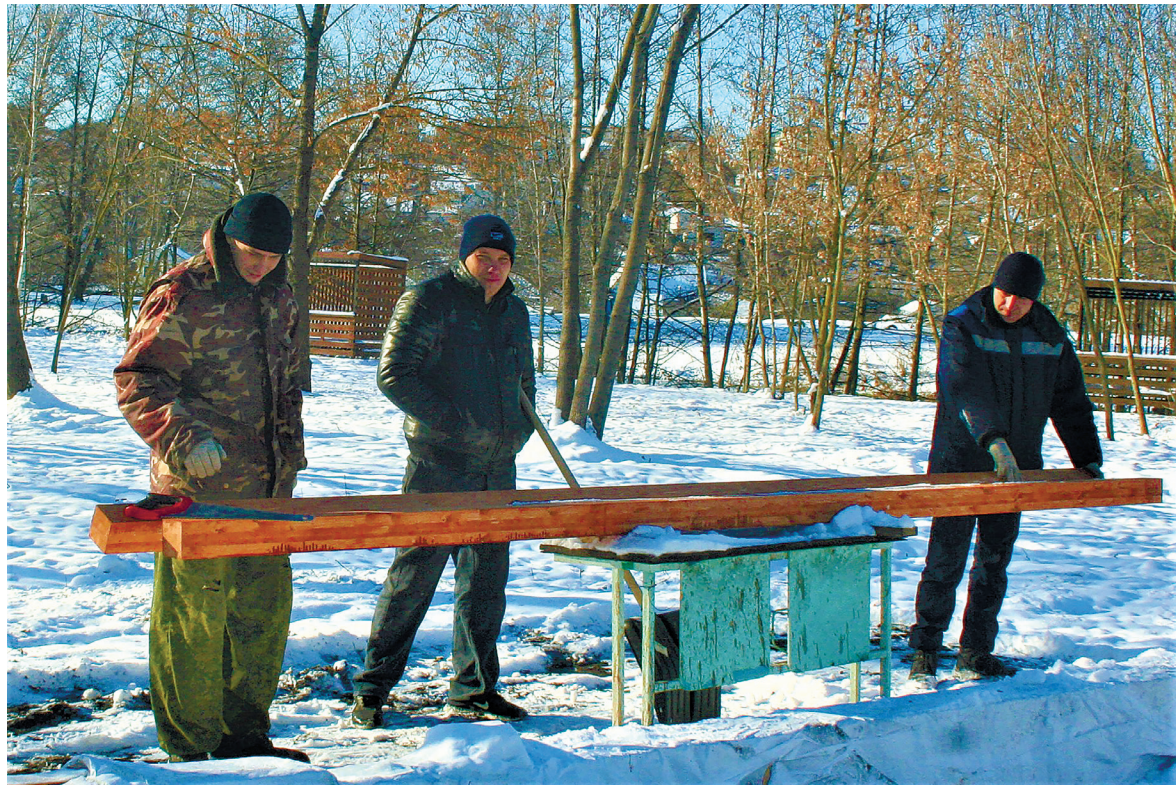
Идёт работа на острове

Это проект некоммерческий – просто захотелось подарить красоту родным местам