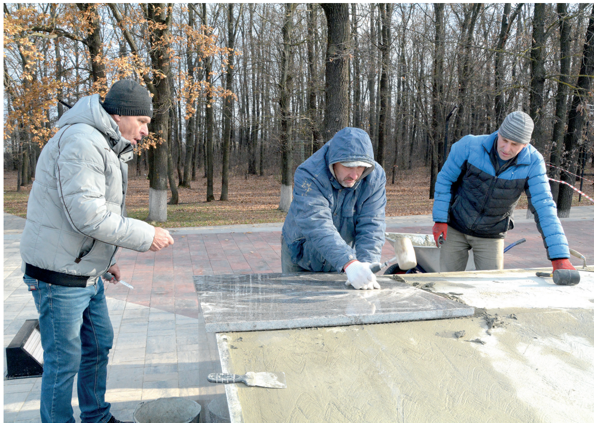
Идёт подготовка новых гранитных плит

Завершается реставрация Мемориала Славы у Атаманского леса