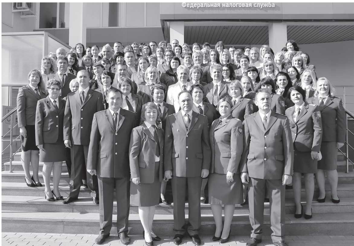
■ Коллектив ИФНС № 4

Контроль за полнотой и своевременностью наполнения государственной казны – непростая задача, выполнение которой требует профессионализма, требовательности, напряжённого каждод-