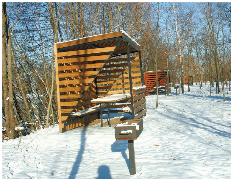
Беседка для летнего отдыха

В заключение он пообещал, что зона семейного отдыха на острове откроется будущим летом.