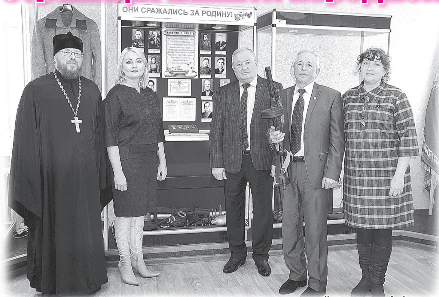
На открытии музейной комнаты.

МАСШТАБНО отметили 75-ю годовщину освобождения села от немецко-фашистских захватчиков в селе Незнамово.