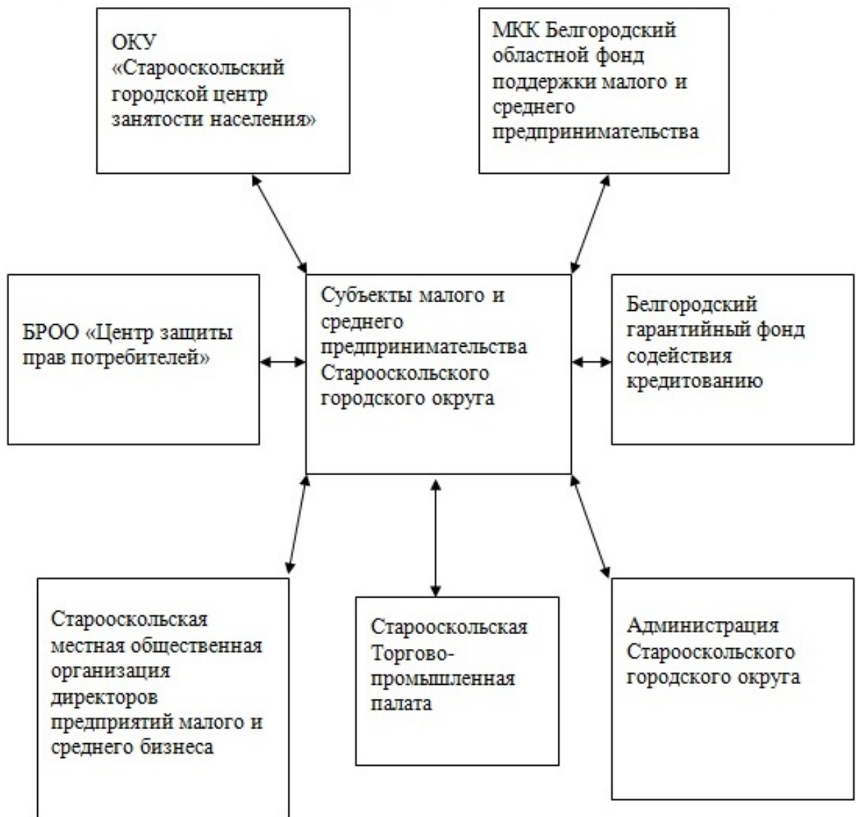
Рис. 2. Элементы инфраструктуры поддержки малого и среднего предпринимательства

Финансовая поддержка малого и среднего предпринимательства Белгородской области осуществляется преимущественно за счет средств областного и федерального бюджетов.