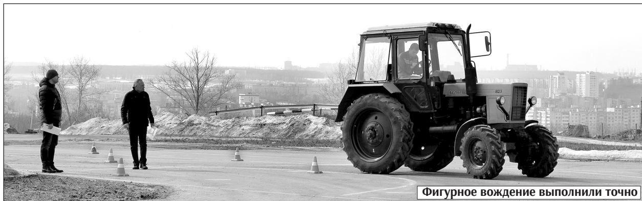
Фигурное вождение выполнили точно