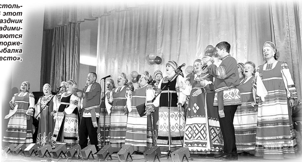
Поют артисты из Владимировки, Знаменки, Rogovatogo.

– Вы, дорогие жители, и есть наше самое большое богатство. Благодарю всех, кто вносит свой