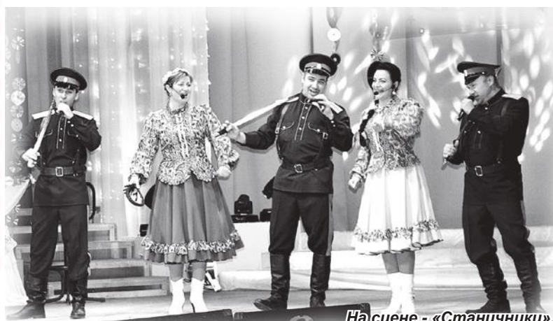
На сцене - «Станичники».

ЗВЕЗДНОЕ кафе «Центр и Фуга» распахнуло свои двери для всех, кто собрался в зрительном зале Центра культуры и искусств в день открытия творческого сезона. В заведении было уютно и очень нескучно, ведь каждый из завсегдатаев дарил зрителям сердечное тепло и свет своего таланта.