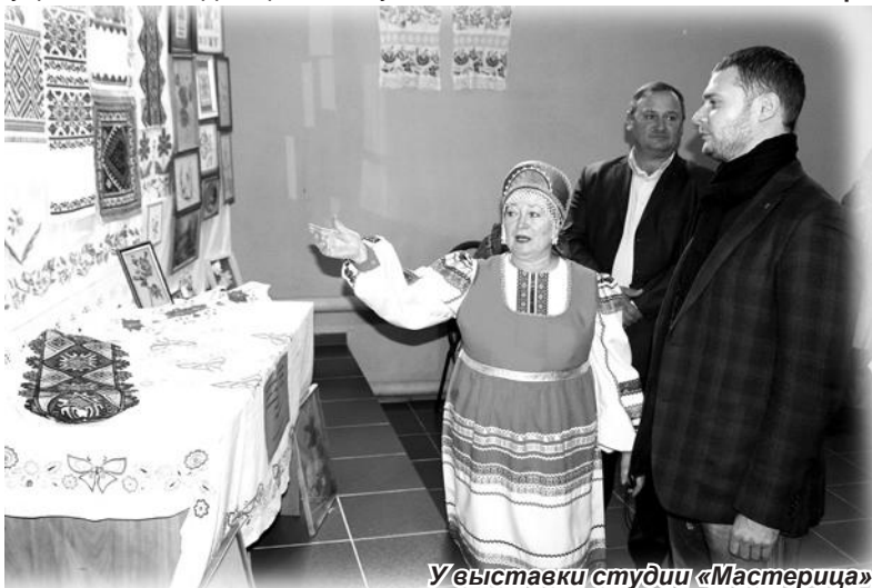
У выставки студии «Мастерица».