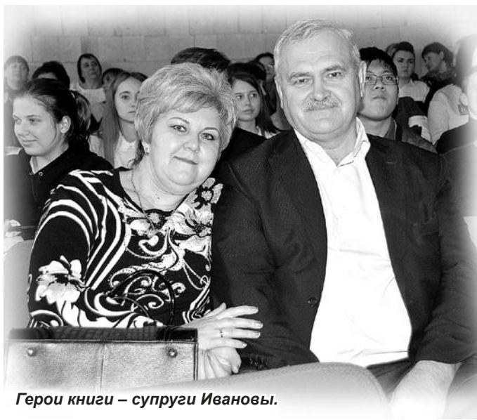
Герои книги - супруги Ивановы.

Над фотооформлением издания работали известный фотохудожник Василий Смотров и краевед Владимир Чуриков.