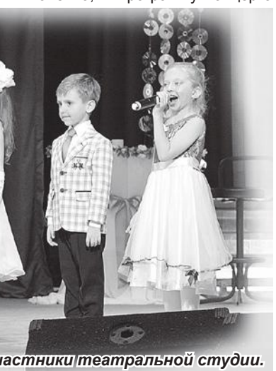
Участники театральной студии.

вошла лишь малая часть того, что могут показать зрителям артисты Центра культуры и искусств. Несомненно, в течение творческого сезона у старооскольцев будет возможность ближе познакомиться с их творчеством. Следите за афишами!