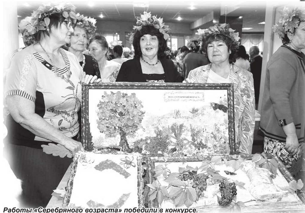
Работы «Серебряного возраста» победили в конкурсе.

КАРТИНЫ , которые мне довелось увидеть на городском конкурсе-выставке «Золотая осень», могут украсить любой интерьер, придав ему уют и особый шик. Вот только проживут они совсем недолго, поскольку в рамках – настоящие дары полей, лесов и садов.