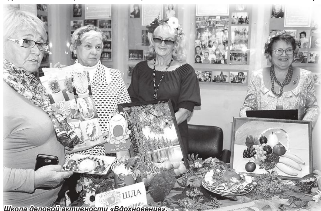
Школа деловой активности «Вдохновение».

Не менее интересной получилась мини-выставка ШДА «Мечта». Ее участницы демонстрировали картину, в центре которой – овощи со своих огородов. Участники ШДА