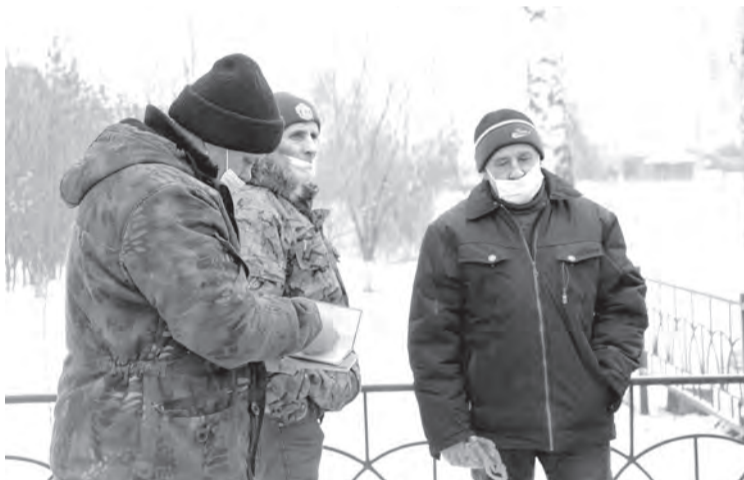
Роговатовцы пришли на приём