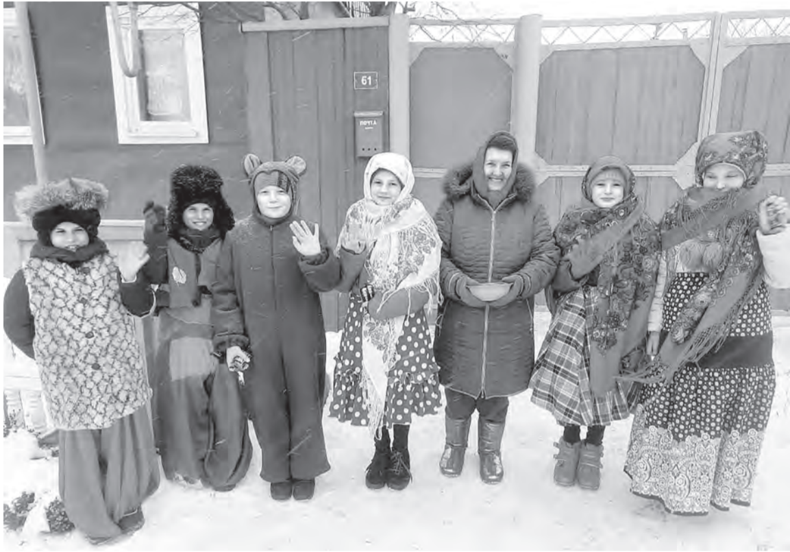
☑ Колядки в Шаталовке