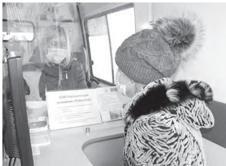
В мобильном офисе ЦЗН

Центр занятости населения провёл открытый отбор в ООО «Гринхаус» и УК «Славянка» в трёх сёлах округа