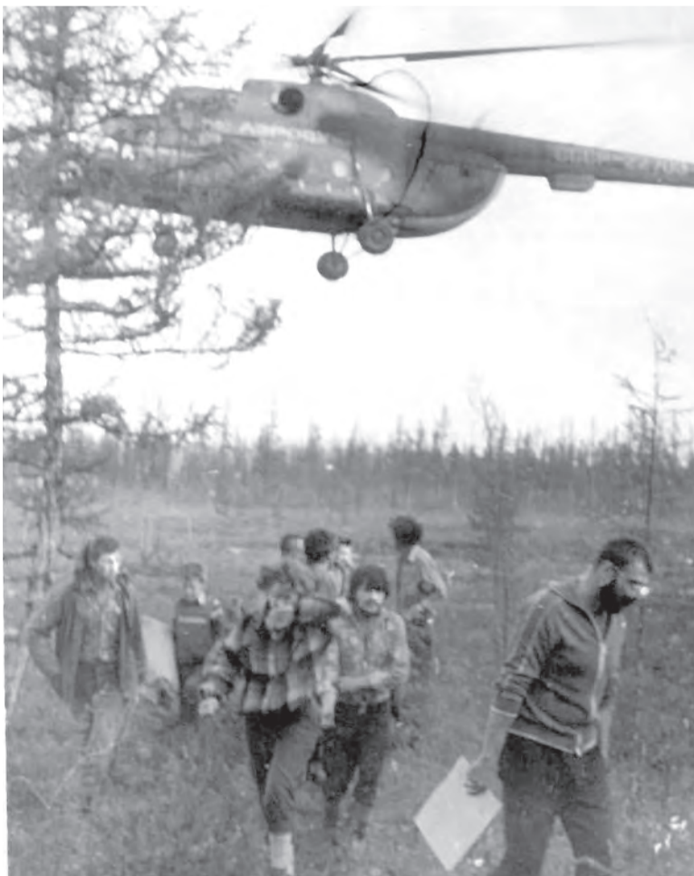
☞ Высадка партии геологов

– Ещё хуже, когда при морозе поднимается ветер. Такое было, кажется, в 1977-м – обморожения получил практически весь посёлок. На работу, помню, бежала перебежками – ребёнка в садик, потом от магазина до магазина. И так же домой. А сын в санках сидел, укутанный, кроме одежды, ещё и в оленью шкуру, как кулёк, даже глаз не видно. Когда мороз 45–50 градусов, стоит чуть дунуть ветерку, чувствуешь себя словно голым, и никакая шуба не помогает. Когда за –50 переваливает, начинаешь чувствовать каждый градус. И слышать. Воздух шелестеть начинает. Плюнешь, пока долетит до земли – уже комочек льда. Птицы замерзли на лету. Воздух воду не принимает, если бельё повесишь сушиться, так весной мокрое и снимешь. А когда за –60, то как-то ощущение холода теряется. Зато ощущаешь нехватку кислорода в воздухе. Дыхание перехватывает, начинаешь кашлять. Пар от дыхания замерзал на ресницах. Потом в тепло зайдёшь, и тушь потекла. Но мы были молодые, всё равно красились.