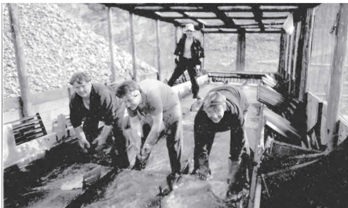
☞ Так моют золотоносную руду

Она жила там, где золотоносные жилы подходят к поверхности земли