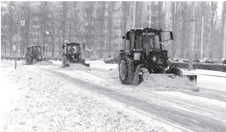
✎ Уборка снега

Надеюсь, что и это мы перенесём хорошо. Нам, как и всем людям на земле, хочется, чтобы быстрее закончился этот кошмар с коронавирусом. Надеюсь, что внесли в борьбу с ним свой небольшой вклад.