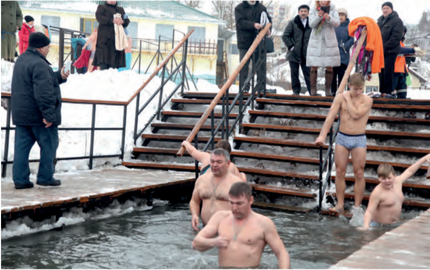
Кто смелый, тот в прорубь!