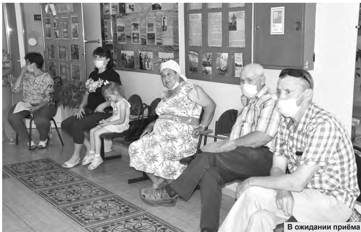
В ожидании приёма

– День села и престольный праздник у вас 9 августа, может,