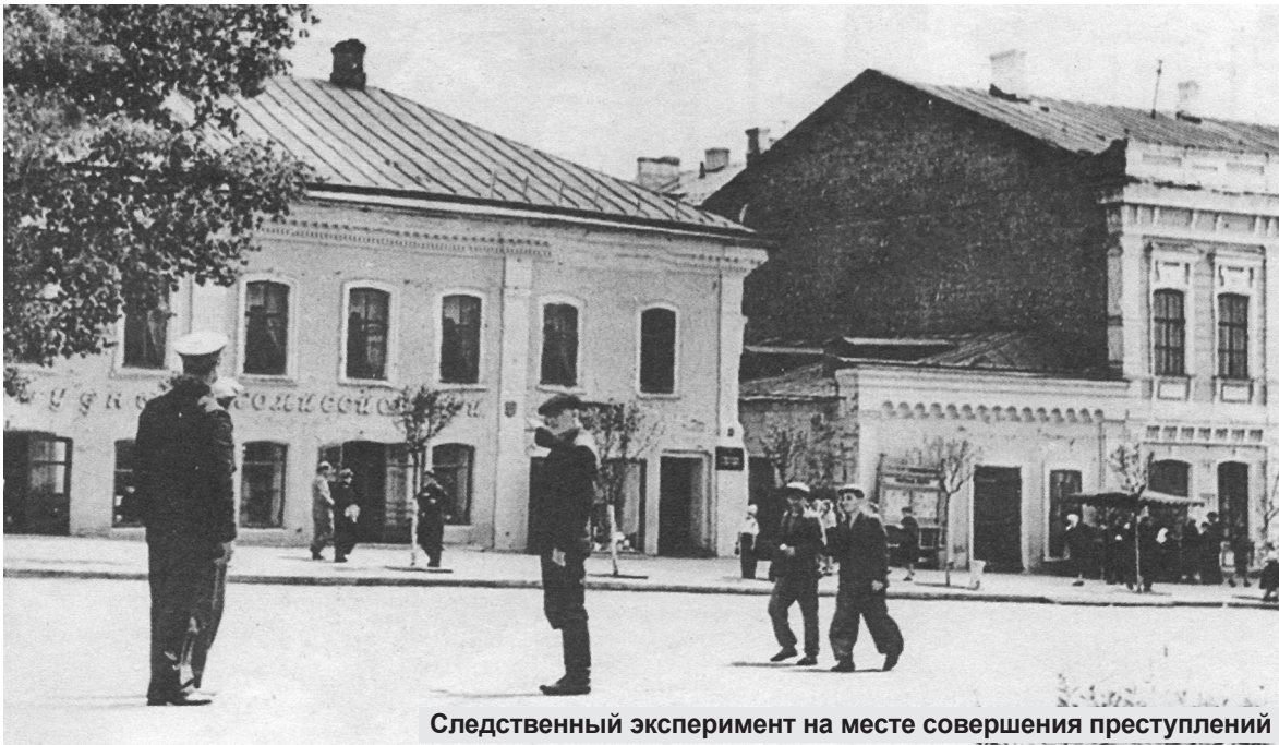
Следственный эксперимент на месте совершения преступлений