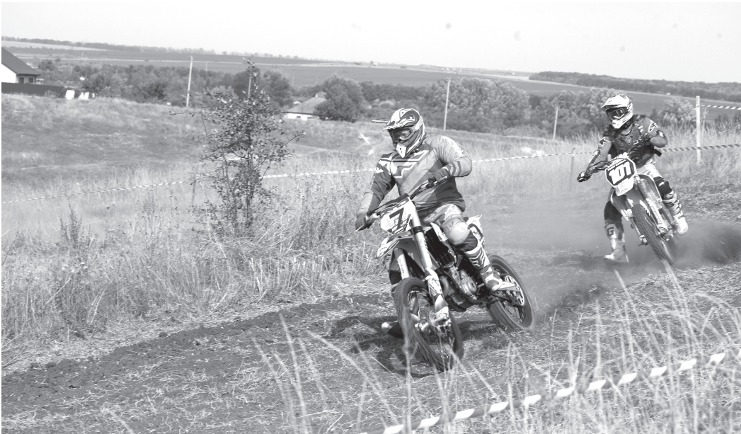
На трассе мотокросса