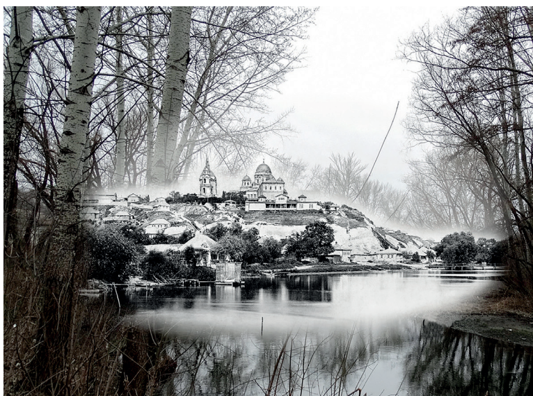
Вид на улицу Ленина с противоположного берега реки Оскол

Теперь пройдемся в сторону северо-восточной части города по улице Комсомольской и остановимся на пешеходном переходе возле здания Центральной районной больницы, построенного