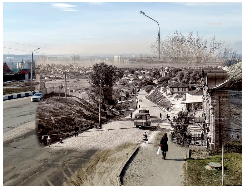
По улице Комсомольской спускаемся в юго-западную часть города