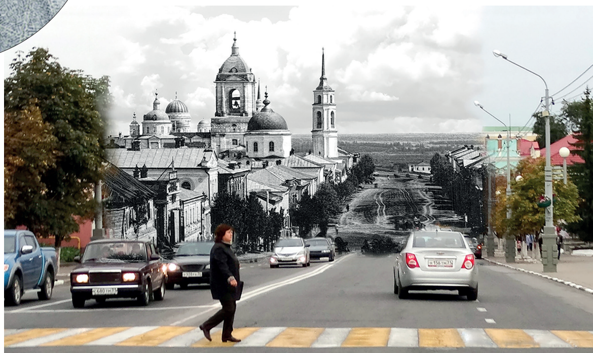
Улица Курская (Ленина) конца XIX века