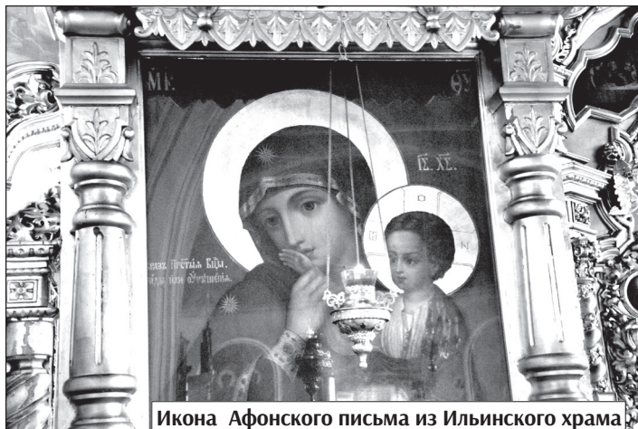
Икона Афонского письма из Ильинского храма