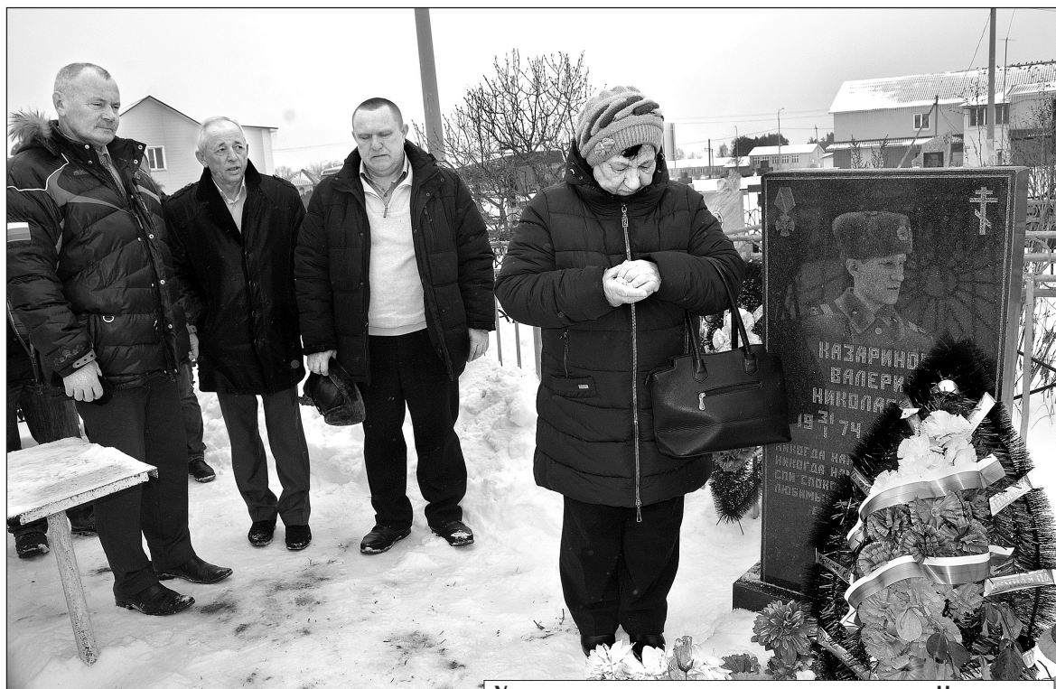
У могилы воина-интернационалиста в селе Незнамово