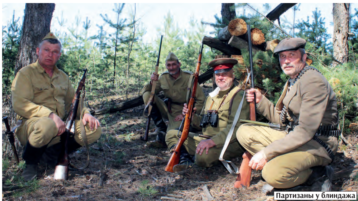
Партизаны у блиндажа