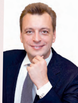
Игорь БАРЩУК , депутат Белгородской областной Думы шестого созыва