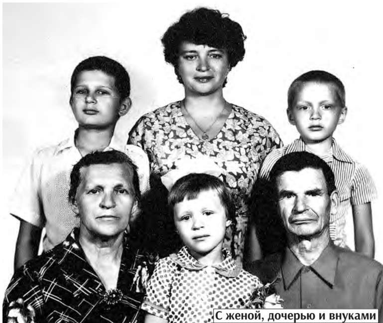
С женой, дочерью и внуками