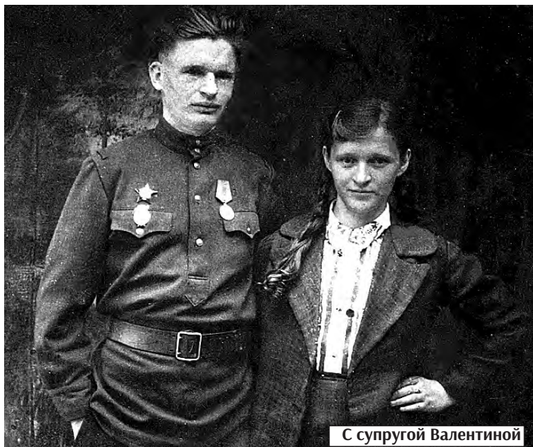
С супругой Валентиной