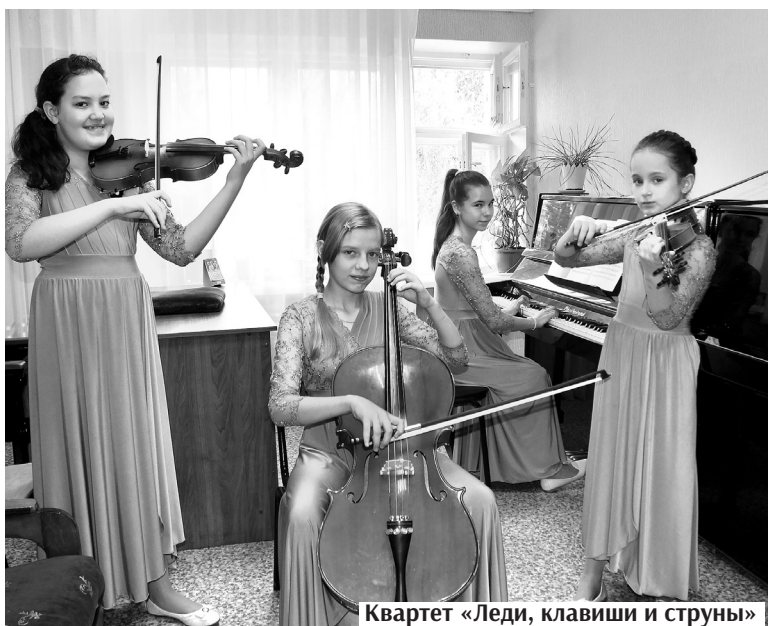
Квартет «Леди, клавиши и струны»