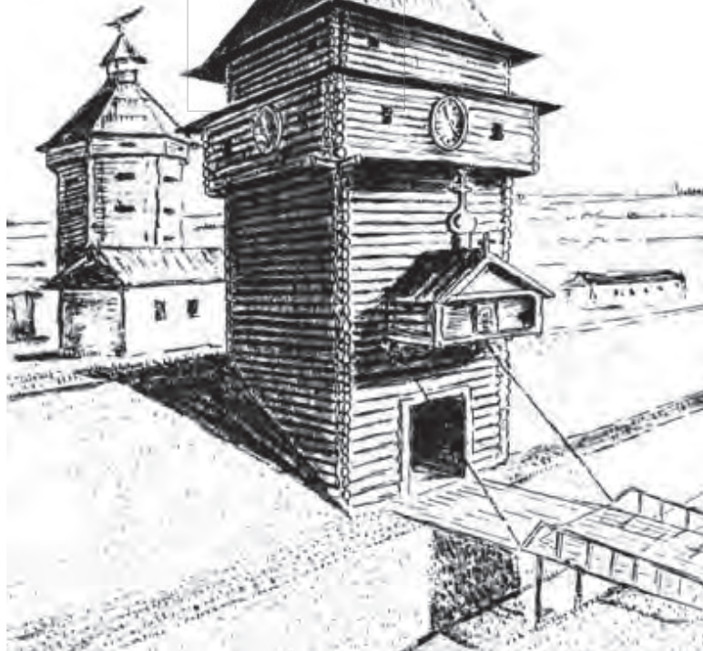
Так могла выглядеть въездная башня Оскольской крепости.

Старооскольцам не мешало бы поместить на территории бывшей Оскольской крепости памятный знак в честь данного события.