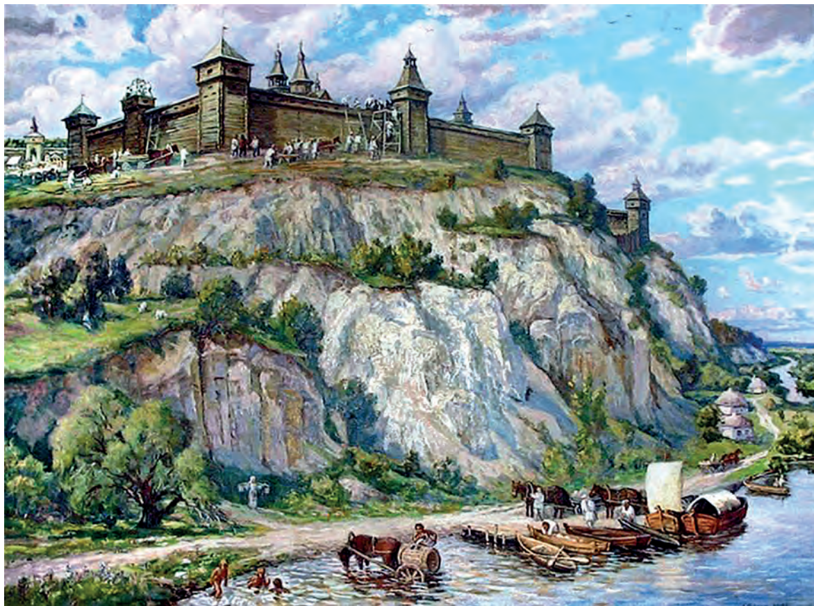
Деревянная крепость на меловом мысе