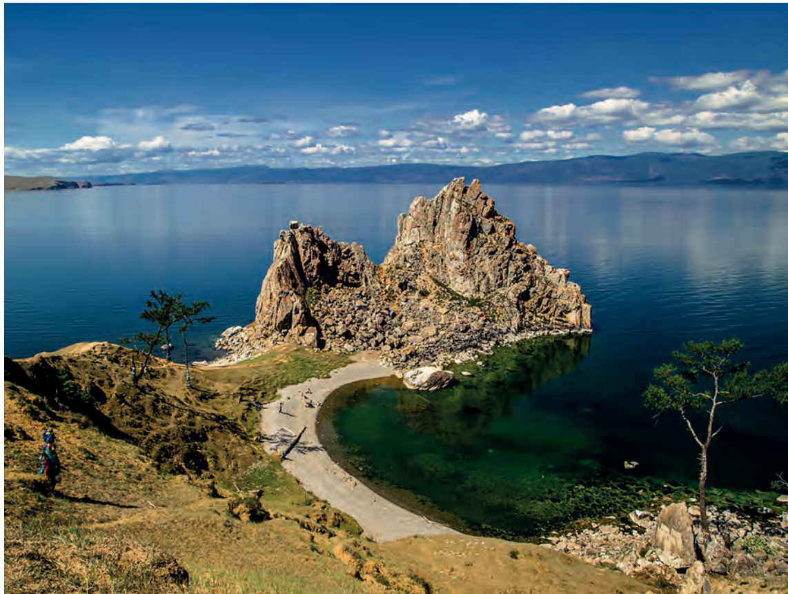
Байкал, остров Ольхон, мыс Бурхан, скала Шаманка

Если сравнивать стоимость путёвок, то в апреле и в середине мая, например, Турцию на 10 дней на двоих продавали от 40 тысяч рублей, включая перелёт. В это же время в Анапе, если всё включено, вы потратите от 54 тысяч рублей без дороги, в Сочи на 10 дней без учёта стоимости проезда отдых в отеле такого класса будет стоить в среднем 130