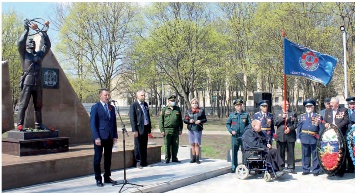
В сквере Ликвидаторов

– Когда 26 апреля 1986 года случилась авария, мы были ближе всех к месту событий, и пока все подъезжали, уже начали там выполнять задачи, – рассказал Константин Владимирович. – Мне было тогда 19 лет, и я полностью ещё не понимал серьёзность ситуации. Сначала участвовал в оцеплении, потом разгружал приезжающие вагоны со свинцом. Нет точных данных, сколько получил радиации. Наверное, спасло то, что ветер