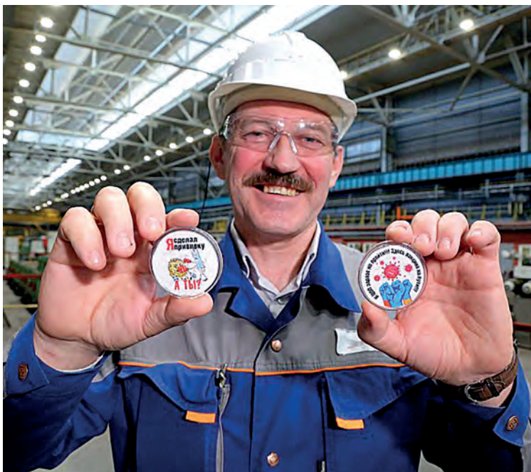
■ На ОЭМК им. А.А. Угарова тем, кто вакцинировался, дарят специальные значки

Многим помогли удержаться от банкротства субсидии на компен-