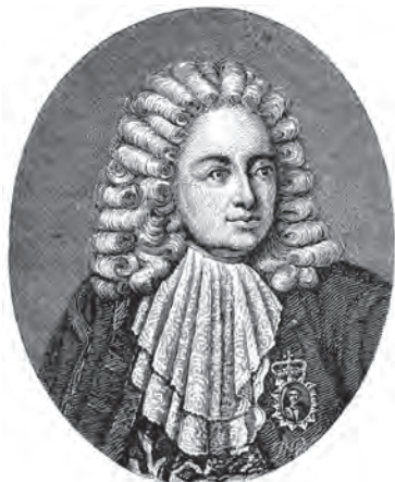
Генерал Патрик Гордон