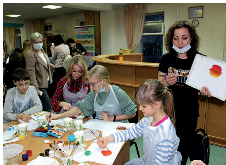
В эту ночь рисуют все!

«Библионочь» прошла и в некоторых других библиотеках округа. К примеру, в Центральной детской библиотеке № 7 о