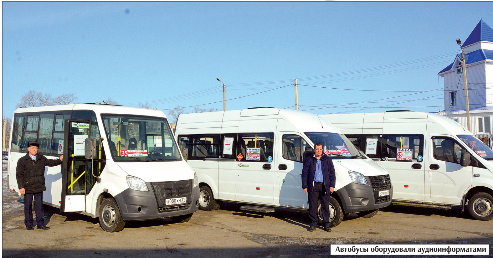
Автобусы оборудовали аудиоинформатами

Каждую остановку на маршруте №35 теперь объявляют аудиоинформаты. Эти небольшие приборы установлены в маршрутных автобусах и подключены к системе ГЛОНАСС. Водителю не требуется нажимать на кнопки. Записанный в компьютер голос автоматически включается, как только автобус подъезжает к остановке.