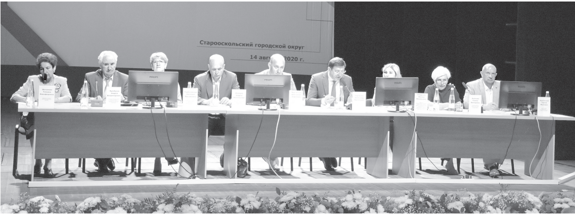
❖ На коллегии

Инвестиции в проект запланированы в объёме около 1 млрд рублей. На производстве мелящих шаров будет создано 85 рабочих мест. Годовая производительность шаропрокатного стана – 43 тысячи тонн мелящих шаров диаметром 100–120 мм.