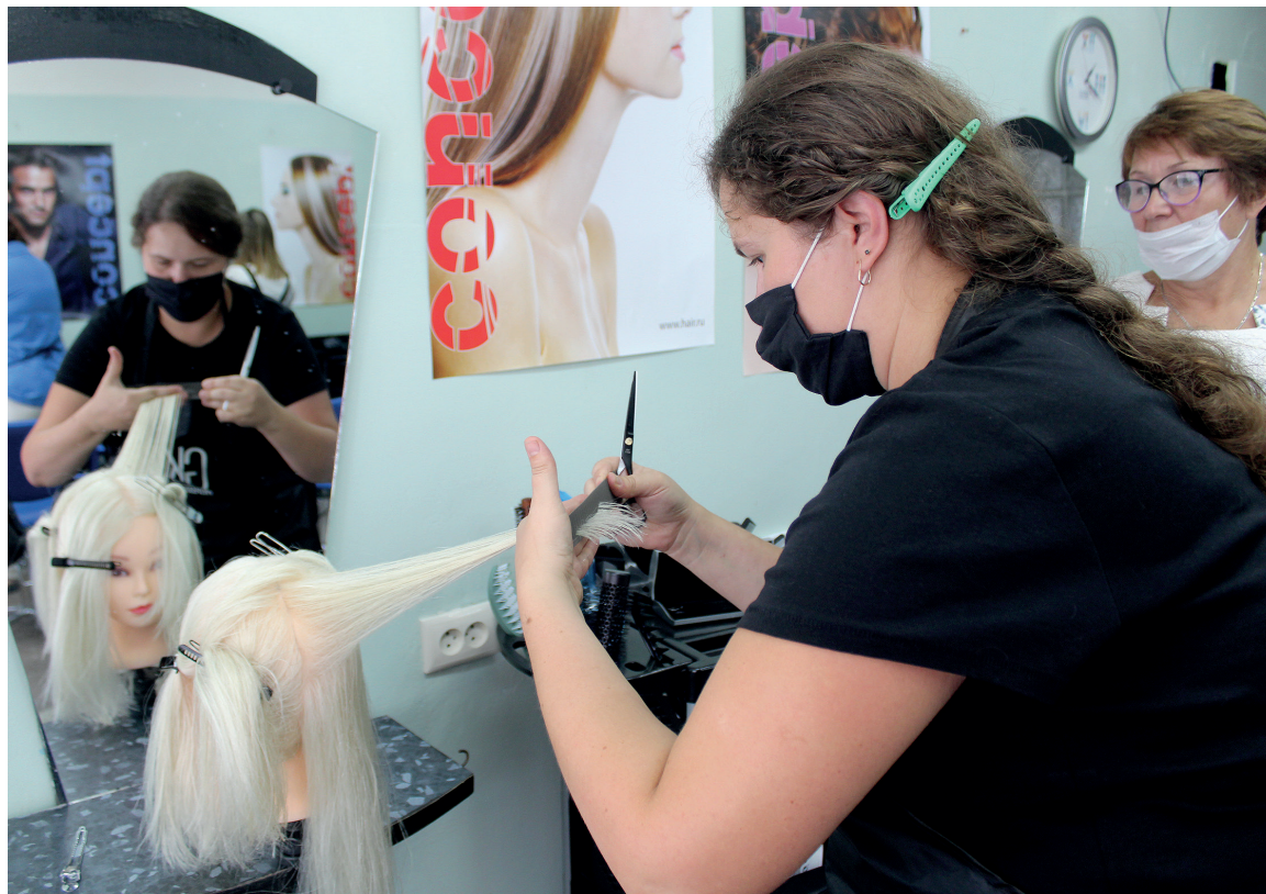
Занятия по парикмахерскому искусству

Как женщины могут переобучиться во время отпуска по уходу за ребёнком