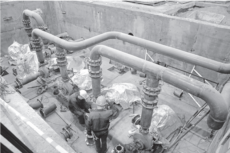
❖ Холодная прокрутка оборудования

Со временем серьёзный экзамен на готовность к вводу в эксплуатацию пройдут все участки шаропрокатного стана, где будет происходить превращение круглой стальной заготовки в мелящие шары: склад исходной заготовки, куда в самое ближай-