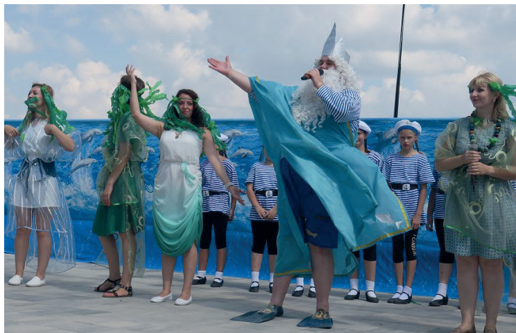
Гостей приветствует Нептун