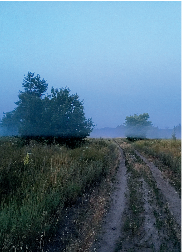
Часть туманного кольца

Ну, вот и разгадка. Явление оказалось довольно обычным, хотя и нечасто мы, горожане, имеем возможность увидеть подобное. Словом, удивительное рядом, надо только внимательно смотреть вокруг.