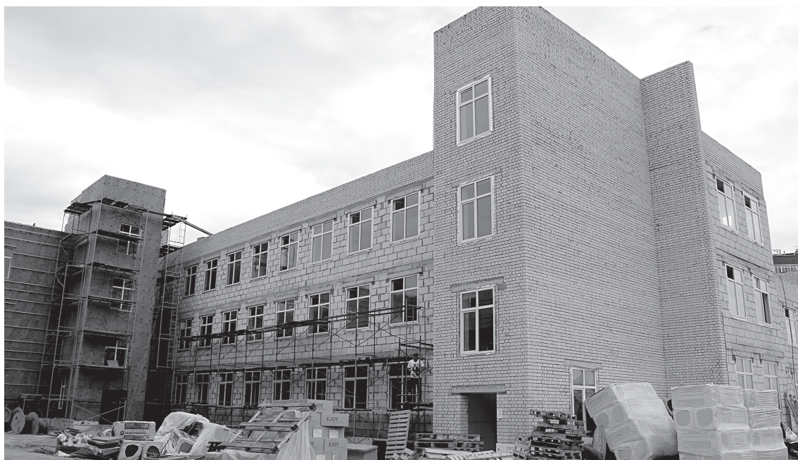
■ Строящаяся школа в микрорайоне Степной

Замглавы администрации округа – секретарь Совета безо-