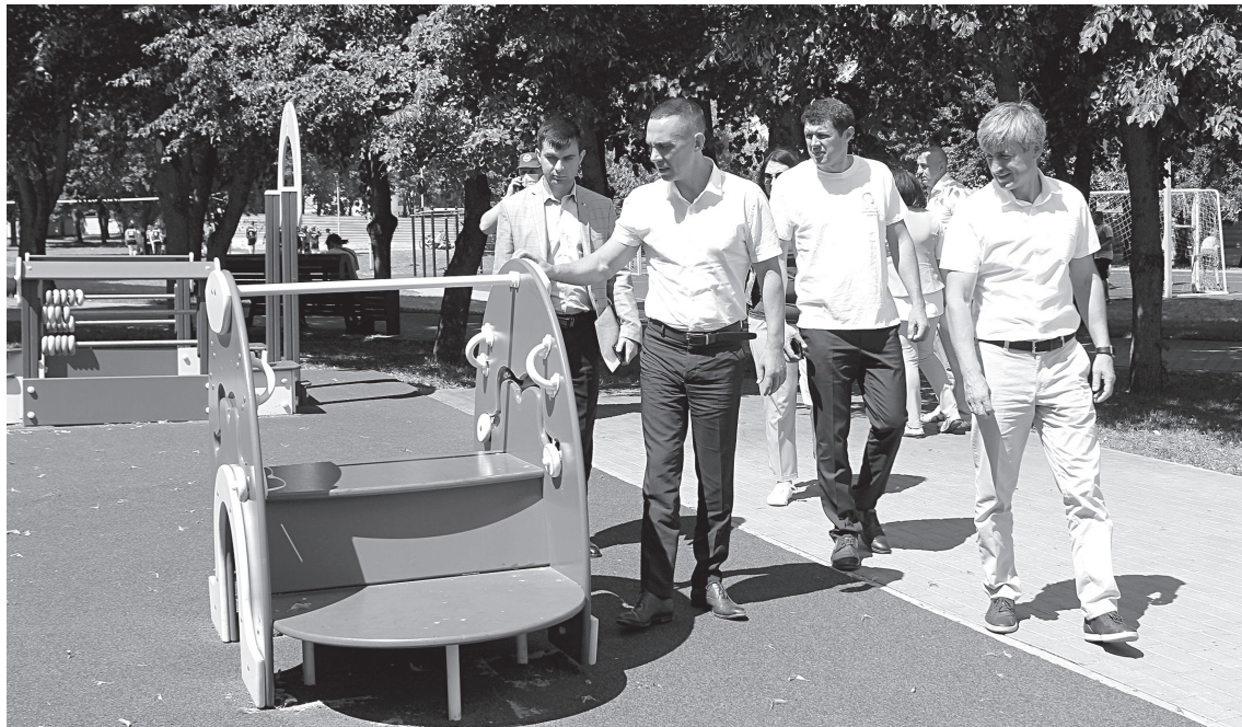
Объезд детских площадок

В Старом Осколе побывали представители областного Совета отцов