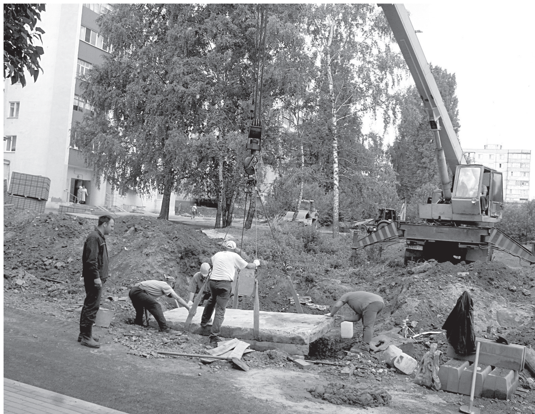
■ Установка плиты над колодцем

Во дворах работает несколько организаций, и важно их слаженное взаимодействие. Это хорошо понимают ремонтники «Теплоэнерго», ко-