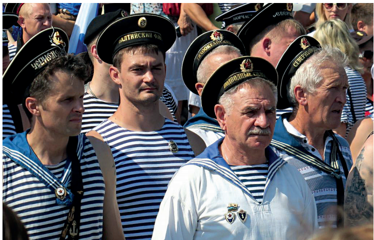
Моряки на митинге