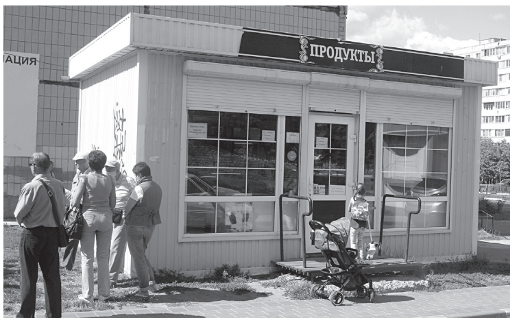
Так выглядит павильон

Теперь слово за администрацией городского округа. Будет ли она искать на это место кого-то, кто окажется лучше Решетова? Лично на меня этот бывший лётчик произвёл приятное впечатление, и продавщицы у него вежливые, и все как на подбор красавицы.