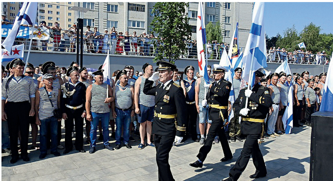
Торжественный марш

торы выделили для построения на торжественный митинг, с трудом вместила всех моряков. Велико морское братство в нашем городе! И каждый год оно пополняется: часть призывников отправляется на флот – чаще Северный или Черноморский. В прошлом году тельняшки надели 29 старооскольцев, в весенний призыв 2019 года – 16.