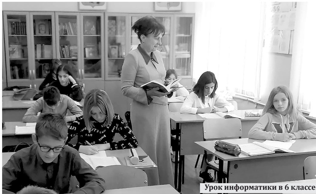
Урок информатики в 6 классе