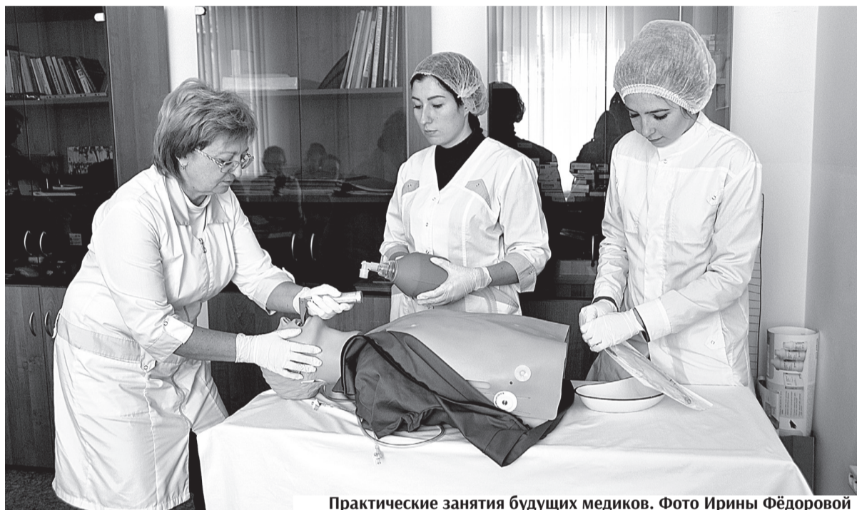
Практические занятия будущих медиков.