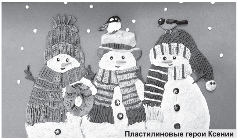
Пластилиновые герои Ксении