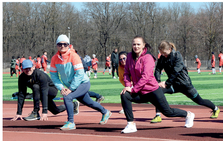
Главное – техника

Тренировка началась с зарядки под руководством Натальи Костаревой. Бодрила громкая музыка, несложные упражнения разогрели мышцы участников для предстоящего теста Купера. Его суть состоит в том, чтобы установить уровень физической подготовки человека и сформировать группы с похожими результатами, определить нужный уровень нагрузки. Чтобы пройти тест, надо непре-