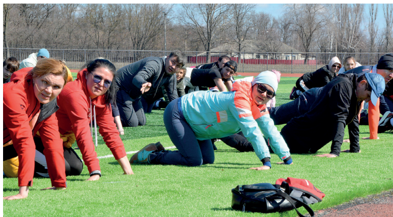
Отдыхаем и слушаем

В итоге статистика такова: около 60 человек записались в «Академию ГТО», 40 – в беговой клуб,