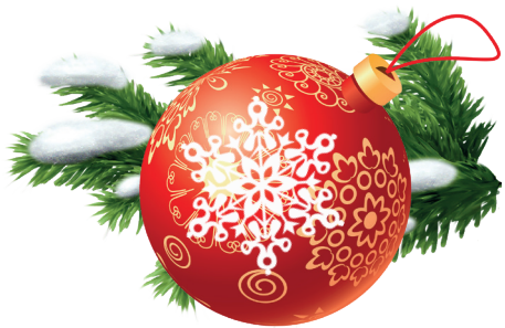
Подготовили Валентина ПАЮСОВА и Елена РОВЕНСКИХ

В наступающем году нам вместе предстоит решить немало задач, и успех будет зависеть от активности, творчества, упорного труда каждого. Пусть новый 2021 год будет щедрым на свершения и успехи, станет для всех временем созидания и творчества. Искренне желаю, чтобы в ваших домах было понимание, тепло и веселье, чтобы новогодние каникулы прибавили сил и энергии. Здоровья вам, счастья, оптимизма в достижении намеченных целей, успехов и благополучия. С Новым годом!