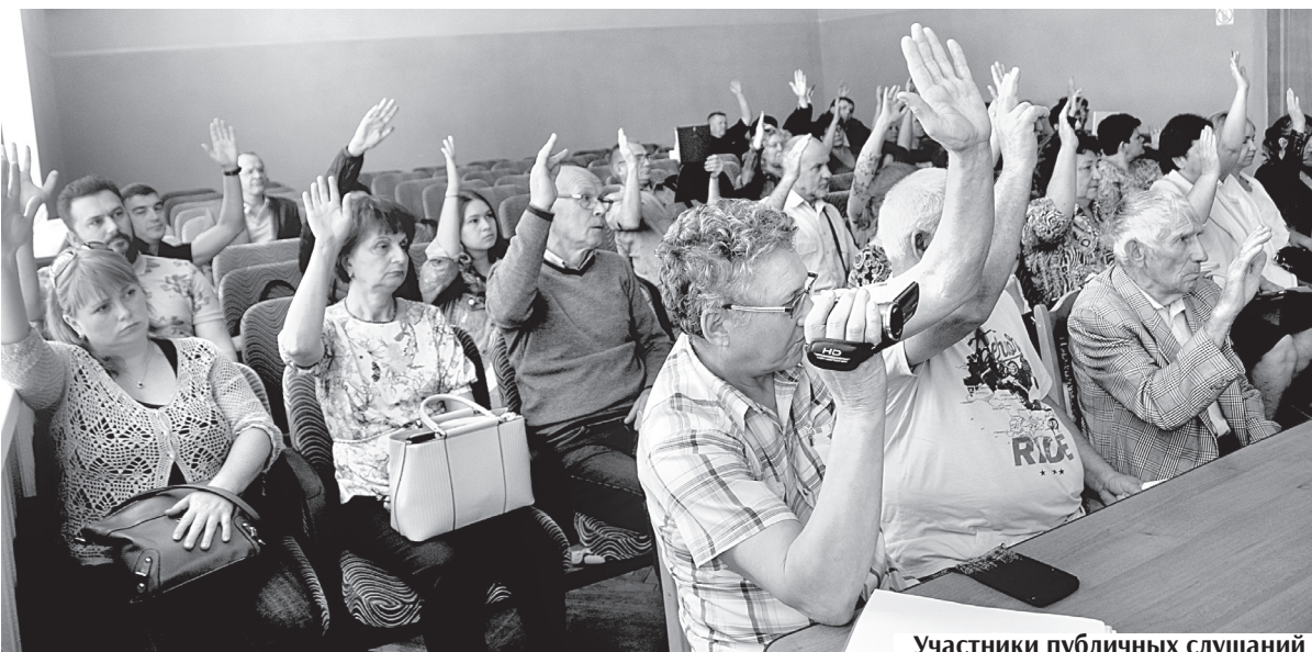
Участники публичных слушаний