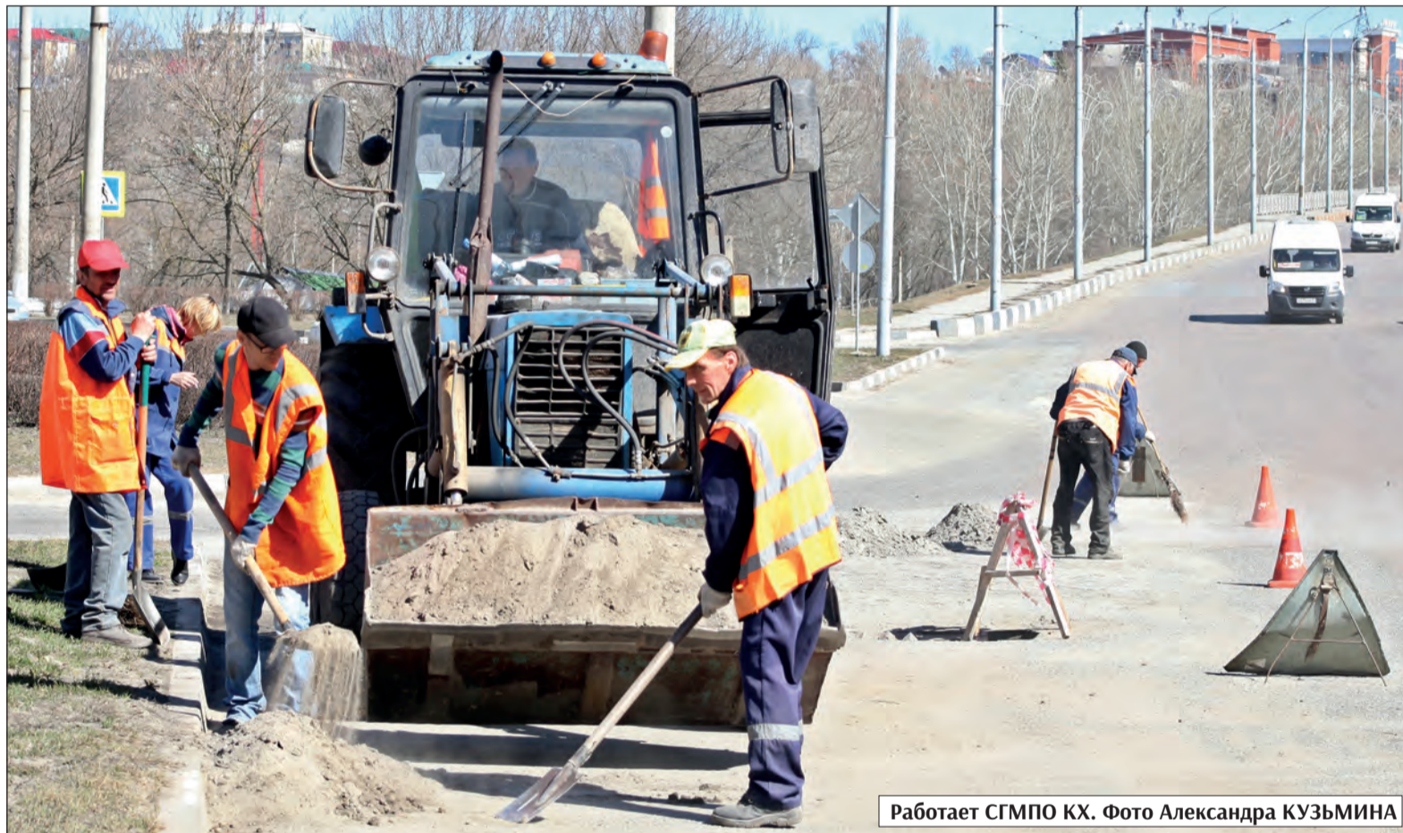
Работает СГМПО КХ.

С первым весенним теплом, которое в этом году явно не спешит, на улицы и дороги города вышли работники муниципальных предприятий, которые убирают зимний песок и мусор. Им помогают трактора, грузовики, комбинированные дорожные машины, утюжат улицы знаменитый «Бродвей». В округе объявлен традиционный ежегодный месячник благоустройства, который продлится до конца апреля.