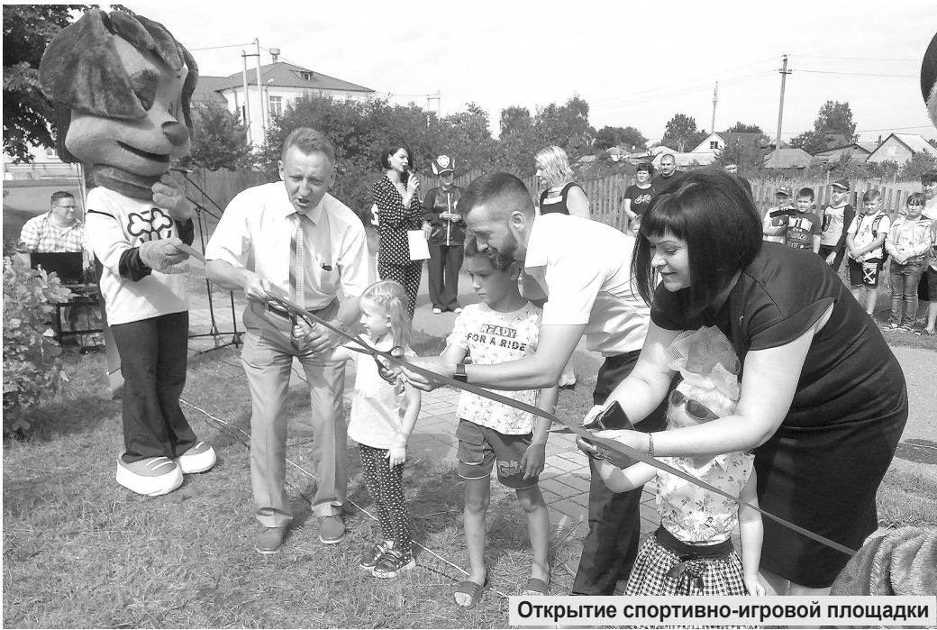
Открытие спортивно-игровой площадки

Естественно, самыми главными гостями праздника были девочки и мальчишки,