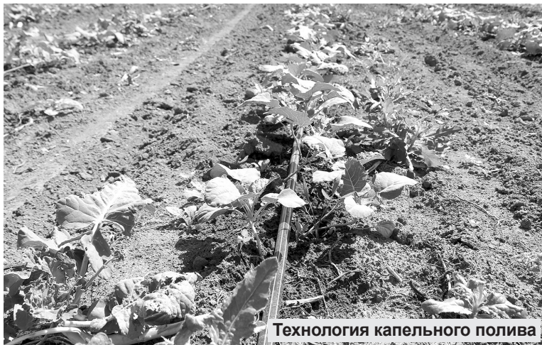
Технология капельного полива