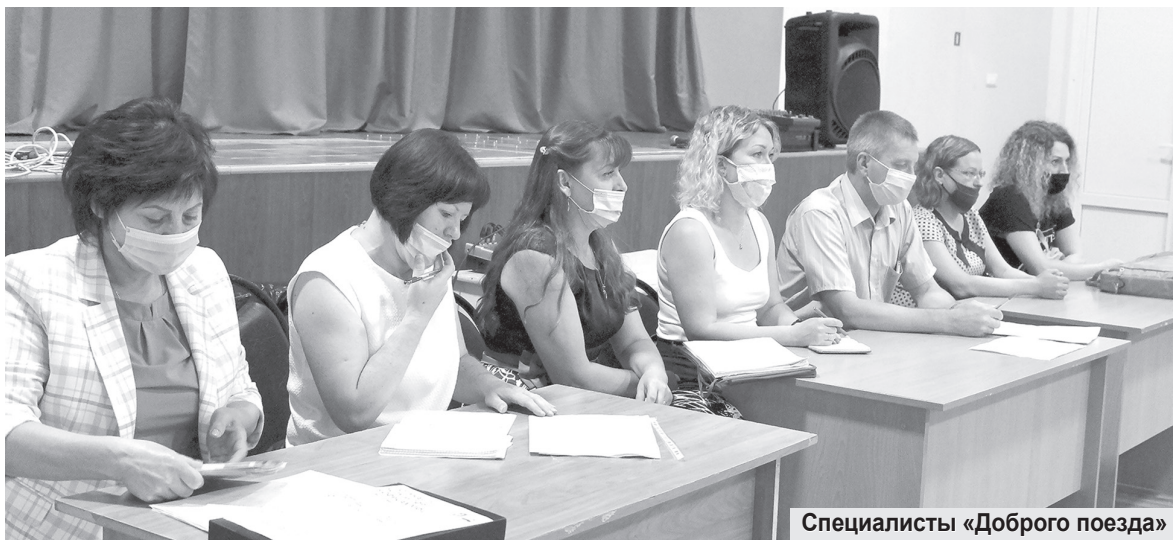
Специалисты «Доброго поезда»