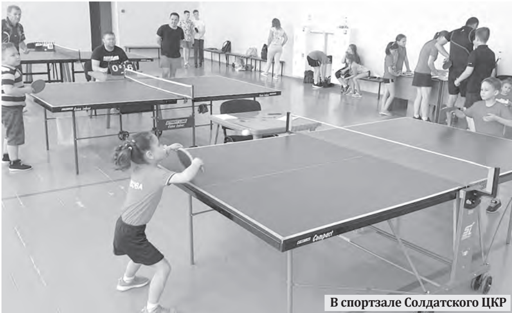
В спортзале Солдатского ЦКР