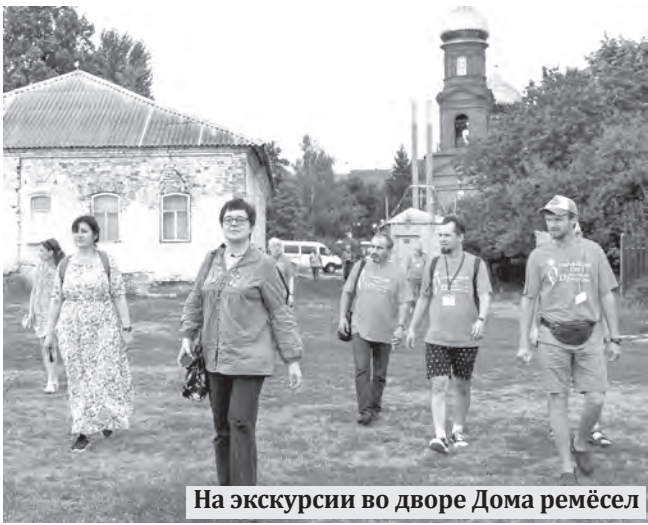
На экскурсии во дворе Дома ремёсел

Программа мероприятия всегда предусматривает знакомство с местной историей, традициями, встречи с народными коллективами, а итоговая выставка становится событием в культурной жизни района. Прошлый раз пленэр проходил в Старом Осколе в 2008 году.