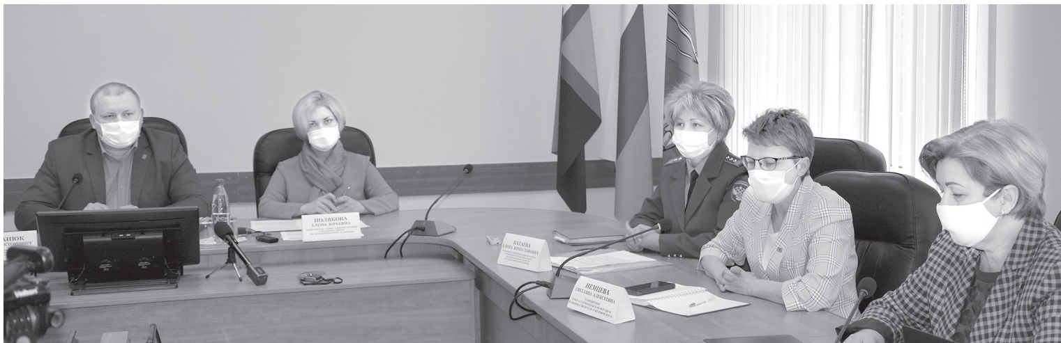
Участники брифинга

Как помочь жителям, пострадавшим от коронавируса, обсудили в администрации округа