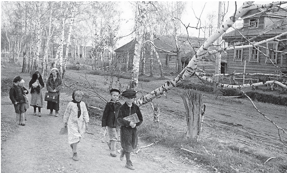
■ На Ржевском направлении. Дети идут в школу по улице недавно освобождённой деревни

Из-за дефицита тетрадей мы их исписывали дважды: сначала писали карандашом, а потом между написанных строчек – чернилами. Забегая вперед, скажу, что в последующих классах бесплатное обеспечение школьников учебниками и тетрадями становилось из года в год всё лучше.