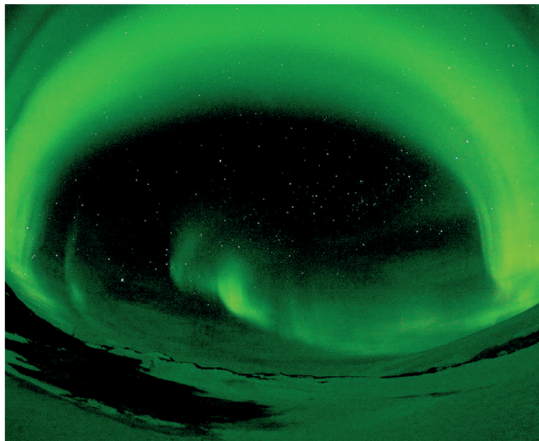
Сияние – «Это такие переливы, такие пульсации, такие цвета! Мы несколько часов, замерзая, стояли на ветру, смотрели в небо... Невороятно! Пожалуй, ничего лучше этого в природе я не видел»

– Свежие фрукты и овощи, как правило, съедаются в начале зимовки, чтобы не успели испортиться. Остальное время едим только замороженное и консервированное, кроме картошки, капусты, лука – они долго хранятся. Немного фруктов нам также доставляют самолётом в то время, когда функционирует аэродром. На станции есть два повара, которые готовят посменно. Раз в месяц каждый полярник дежурил по камбузу, но лично меня это особо не тяготит: в условиях изоляции труд доставляет удовольствие. Ну, а в нерабочее время при хорошей погоде мы с друзьями путешествуем по оазису. Маленький клочок земли, а каждый раз открываешь для себя что-то новое: реки, озёра, водопады, ледяные пещеры, красивые камушки. А какие виды открывались с горных вершин!