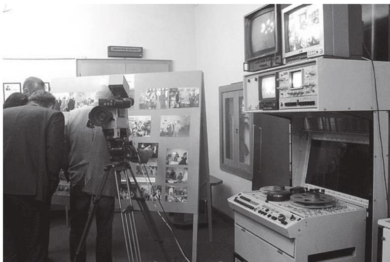
В музее ГТРК «Белгород» — телеоборудование прошлого века.

В случае затруднений с настройкой оборудования для приема цифрового эфирного телевидения можно обратиться в центр консультационной поддержки (ЦКП)