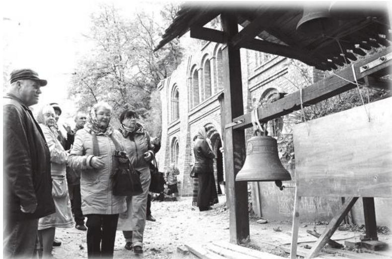
У звонницы храма Александра Невского.

Чужиковская птицефабрика продает большую утку на мясо по 250 руб. 8-962-300-75-76