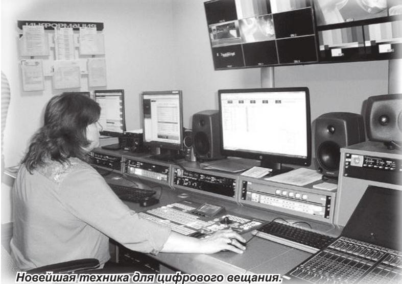
Новейшая техника для цифрового вещания.

Что делать, чтобы отключение не застало врасплох? Ничего сложного. Чтобы не потерять доступ к любимым передачам, можно подключить оборудование для приема