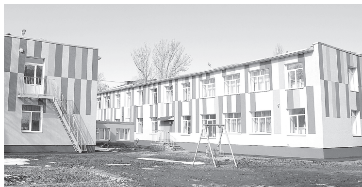
☑ Детский сад № 15 в м-не Горняк

Здесь утеплён фасад, заменены все инженерные сети – канализация, отопление, вентиляция, установлены видеонаблюдение и пожарная сигнализация, переоборудованы пищеблок и прачечная, в саду не осталось ни одного старого