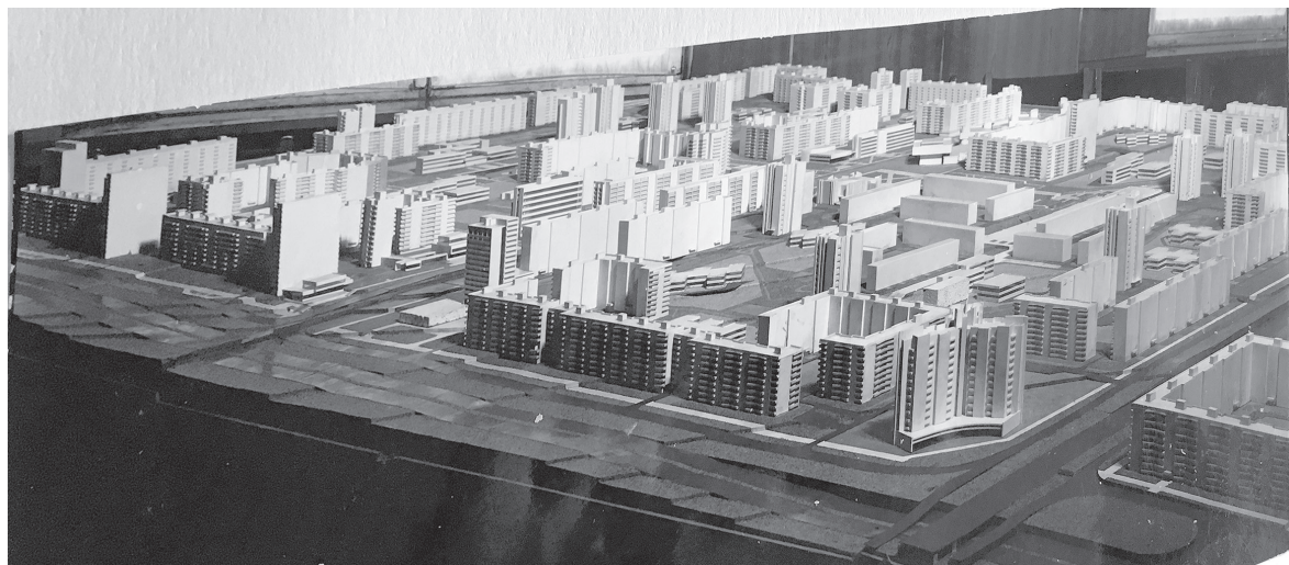
Проект застройки микрорайонов 1–2 / ИЗ ФОТОАЛЬБОМА К.В. БУТОВОЙ «СТАРЫЙ ОСКОЛ. ГЕНЕРАЛЬНЫЙ ПЛАН. ПРОЕКТ И РЕАЛИЗАЦИЯ»