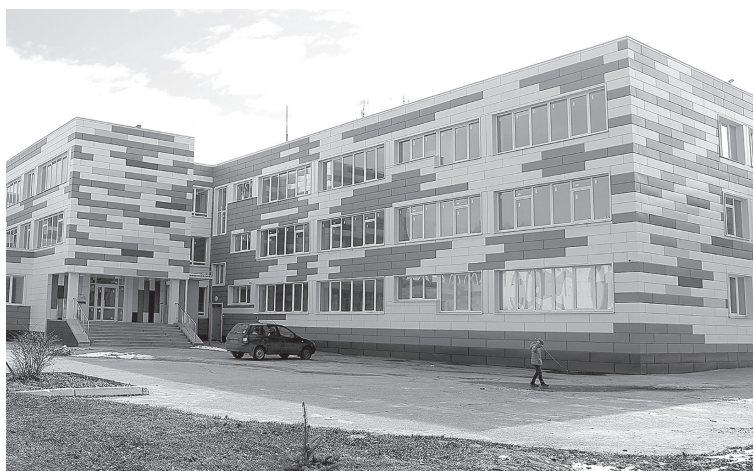
☑ Школа № 15 на Молодогвардейце

Детский сад № 40 носит название «Золотая рыбка», однако его мечты и желания выполняет не героиня пушкинской сказки, а чаще – шефы из сортопрокатного цеха № 1 ОЭМК и Металлоин-