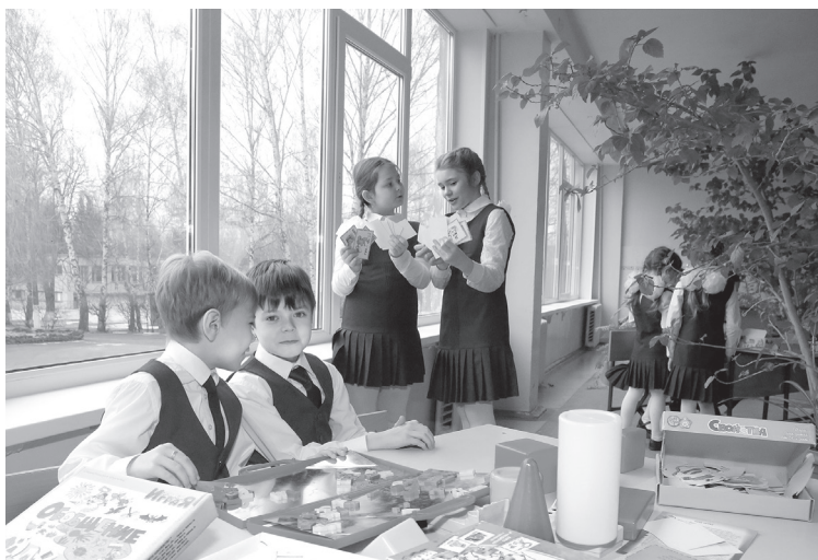
☑ Новые окна в школе № 12

■ В рамках программы социально-экономического партнёрства с правительством Белгородской области на 2020 год компания «Металлоинвест» выделила 28,5 млн рублей на капитальные ремонты образовательных учреждений Старооскольского городского округа. О том, как освоены эти средства, рассказали руководители школ и детских садов, которые затронула масштабная реновация.