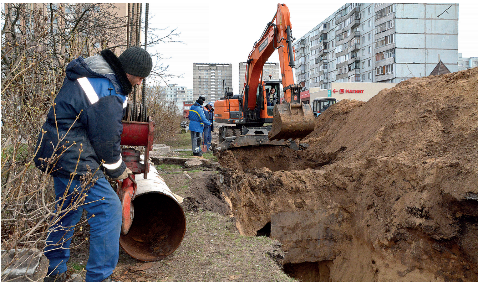
📍 В сквере «Камелия»

Стартовали работы по обновлению городских общественных пространств