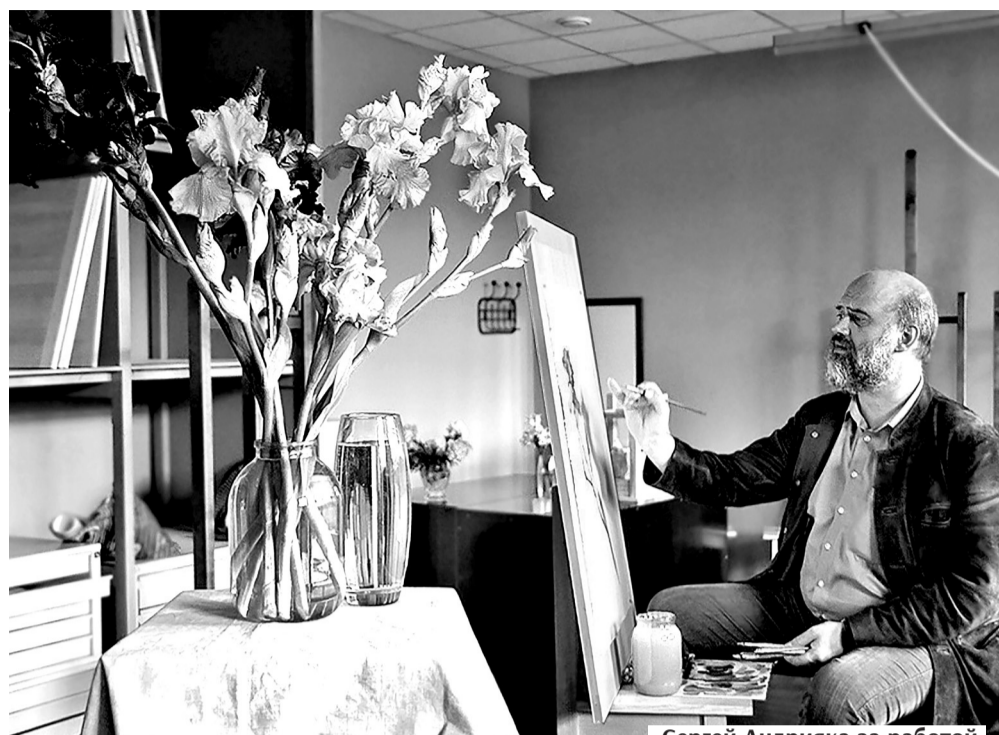
Сергей Андрияка за работой