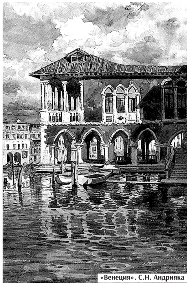
«Венеция». С.Н. Андрияка

Светлана ПИВОВАРОВА