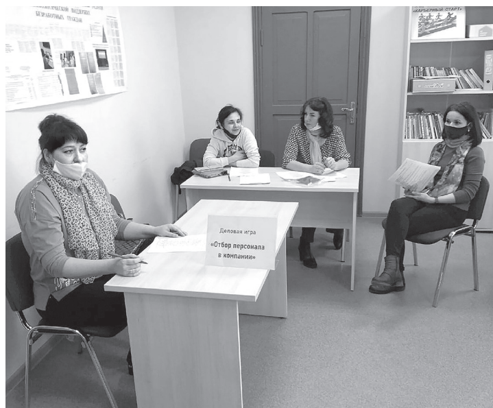
❷ Тренинг для безработных в ЦЗН

Всего в округе количество заброшенных объектов коммерческого назначения за последнее время снизилось более чем на 50 % и составляет 99 единиц. 87 из них расположены на территории города.