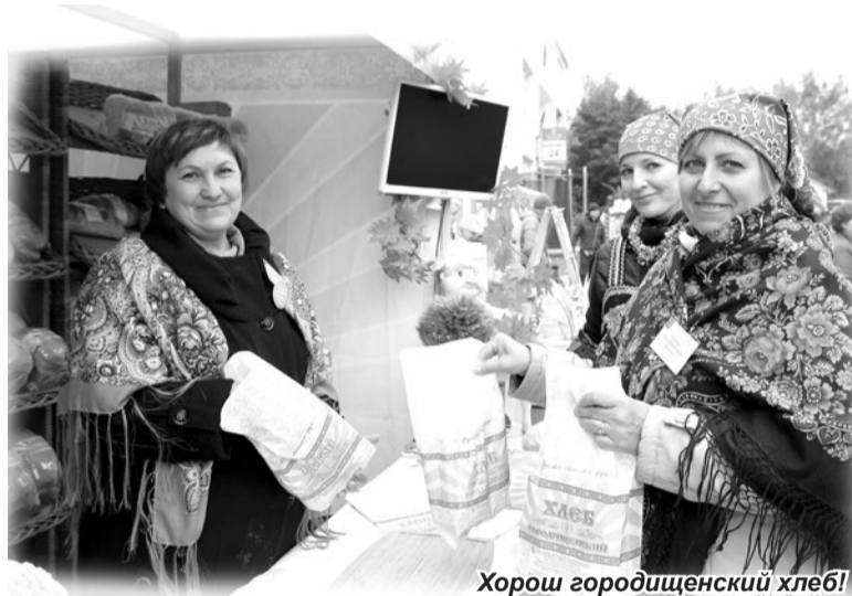
Хорош городищенский хлеб!

А перед зданием ДК уже вовсю гремела музыка. Артисты местного Дома культуры начали театра-