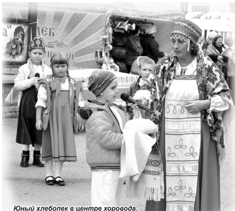
Юный хлебопек в центре хоровода.