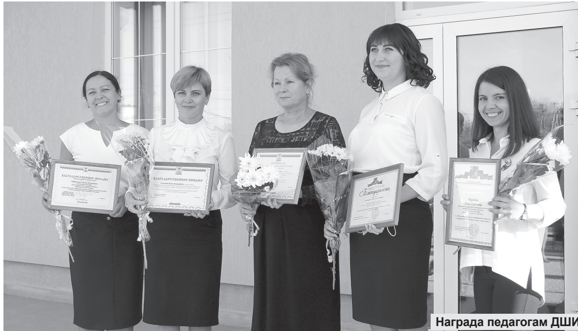
Награда педагогам ДШИ