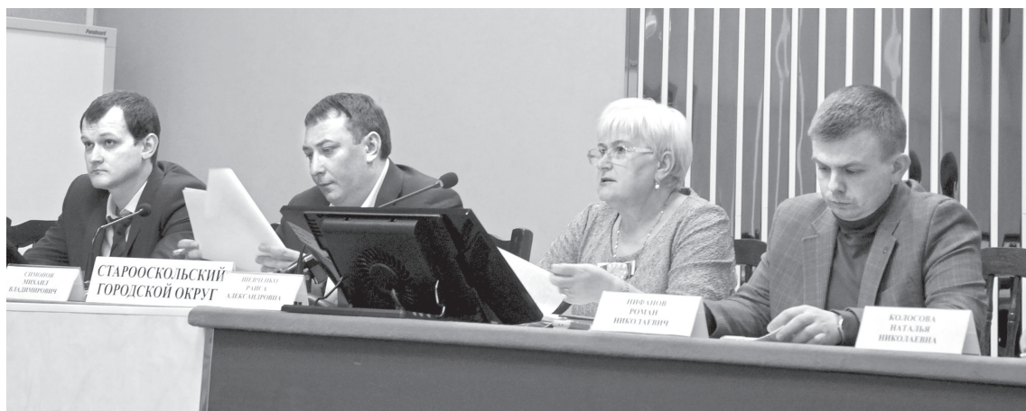
Члены президиума отвечают на вопросы