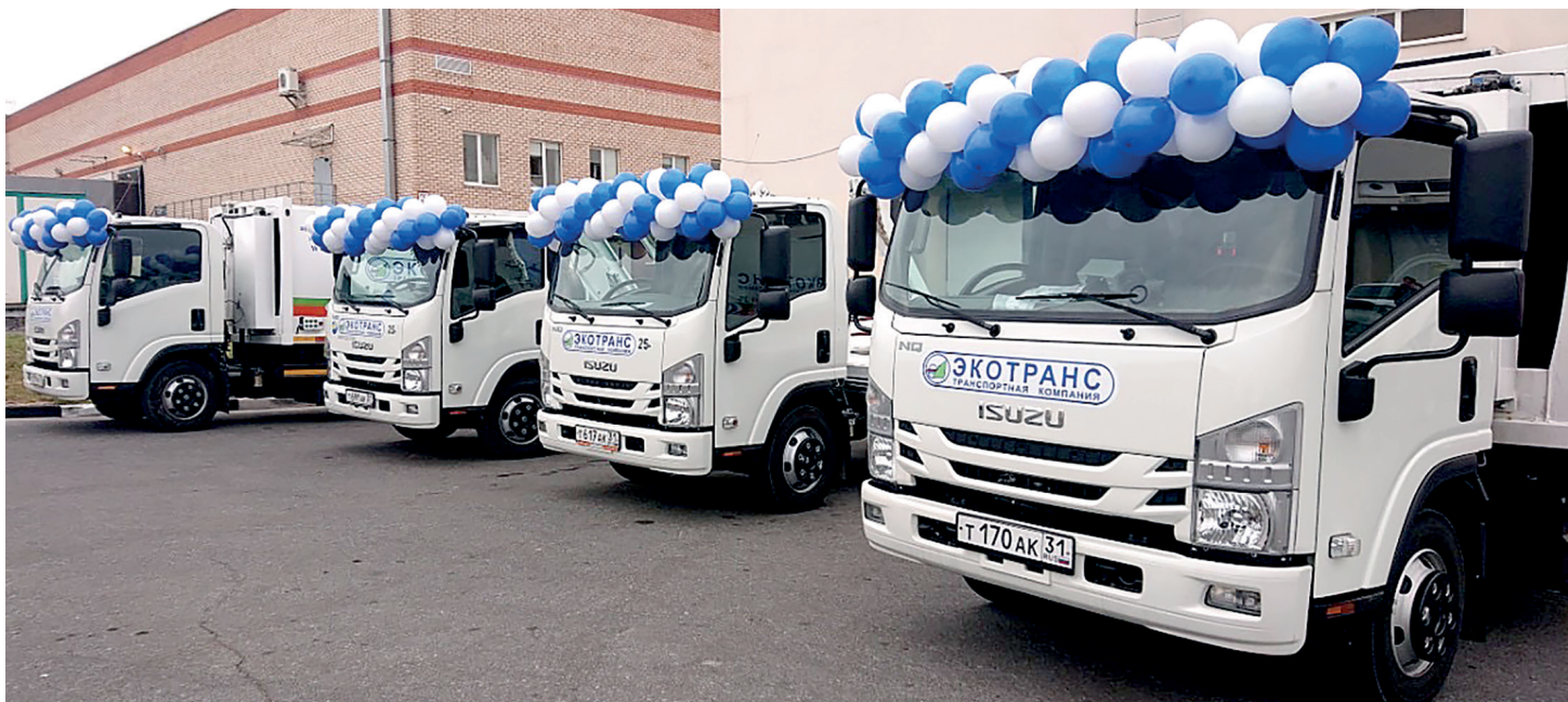
Новые машины