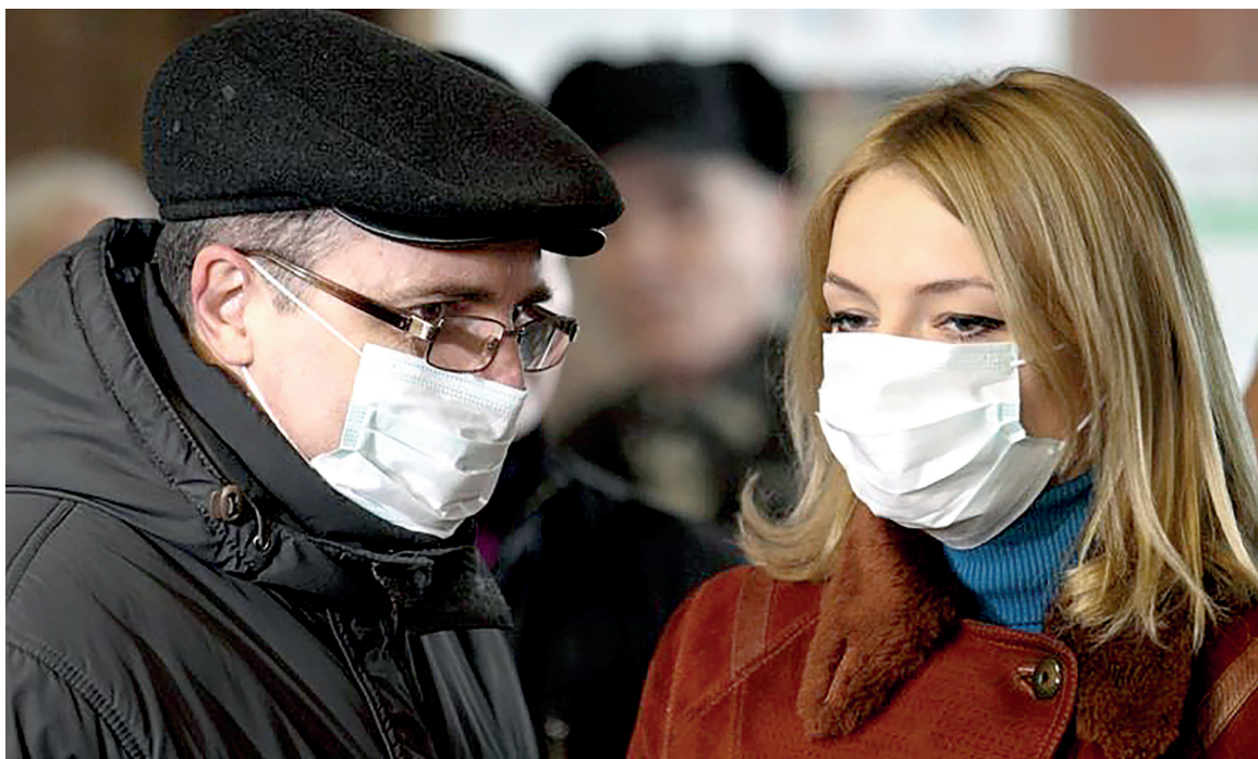
📷 Медицинские маски в аптеках уже не найдёшь, но некоторые запаслись

Город наводнили слухи о заболевших. Правду мы выяснили у специалистов