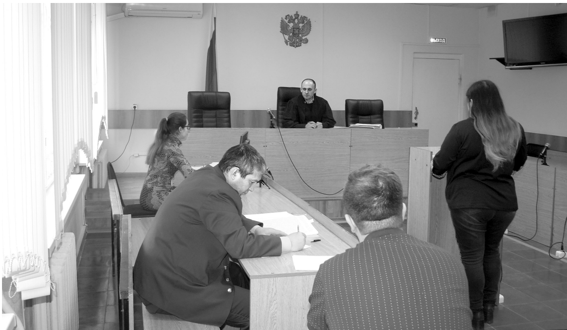
■ Идёт опрос свидетелей

Вид у врача самый благостный. Он производит приятное впечатление, и кажется, что все эти взятки, наркотики – это какое-то недоразумение, следствие нелепых ошибок и стечения обстоятельств. Конечно, он не имеет никакого отношения к миру криминала. На нём никаких тату типа «век воли не видать». Это симпатичный высокий мужчина в расцвете лет в клетчатой рубашке, джинсах и белых кроссовках. С ним в суд пришла приятная женщина – наверное, жена. Видно, очень ему сочувствует и находится здесь, чтобы поддержать.