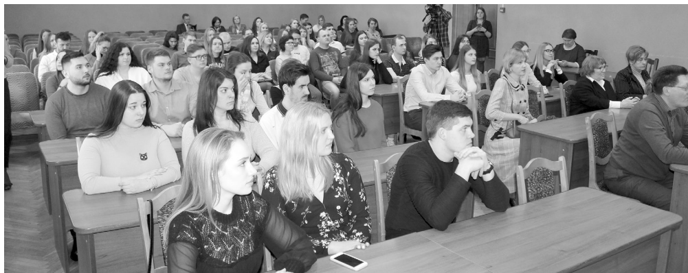
■ Участники встречи