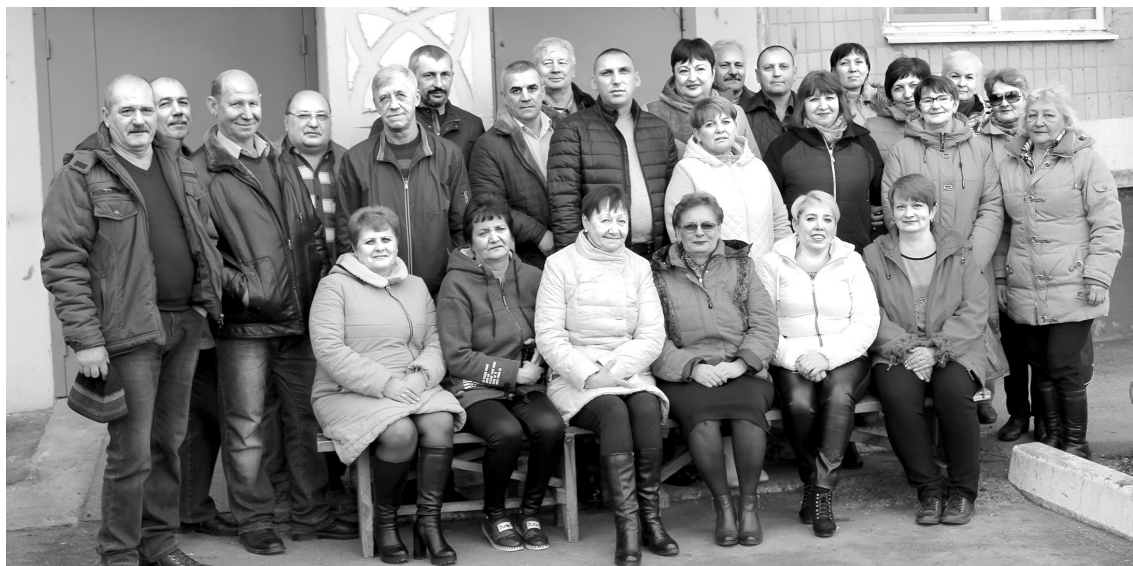
Коллектив УК «ЗЮН-ЖИЛЬЕ»

Накануне Дня работников ЖКХ мы побывали в управляющей компании «ЗЮН-ЖИЛЬЕ»