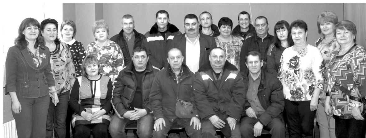
Дружный коллектив УК «Юбилейный»

Цветы делают дворы яркими, улучшают экологию и радуют жителей