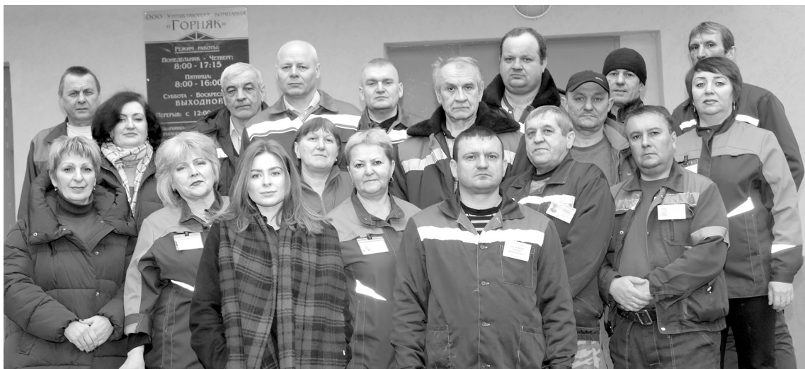
Коллектив УК «Горняк»