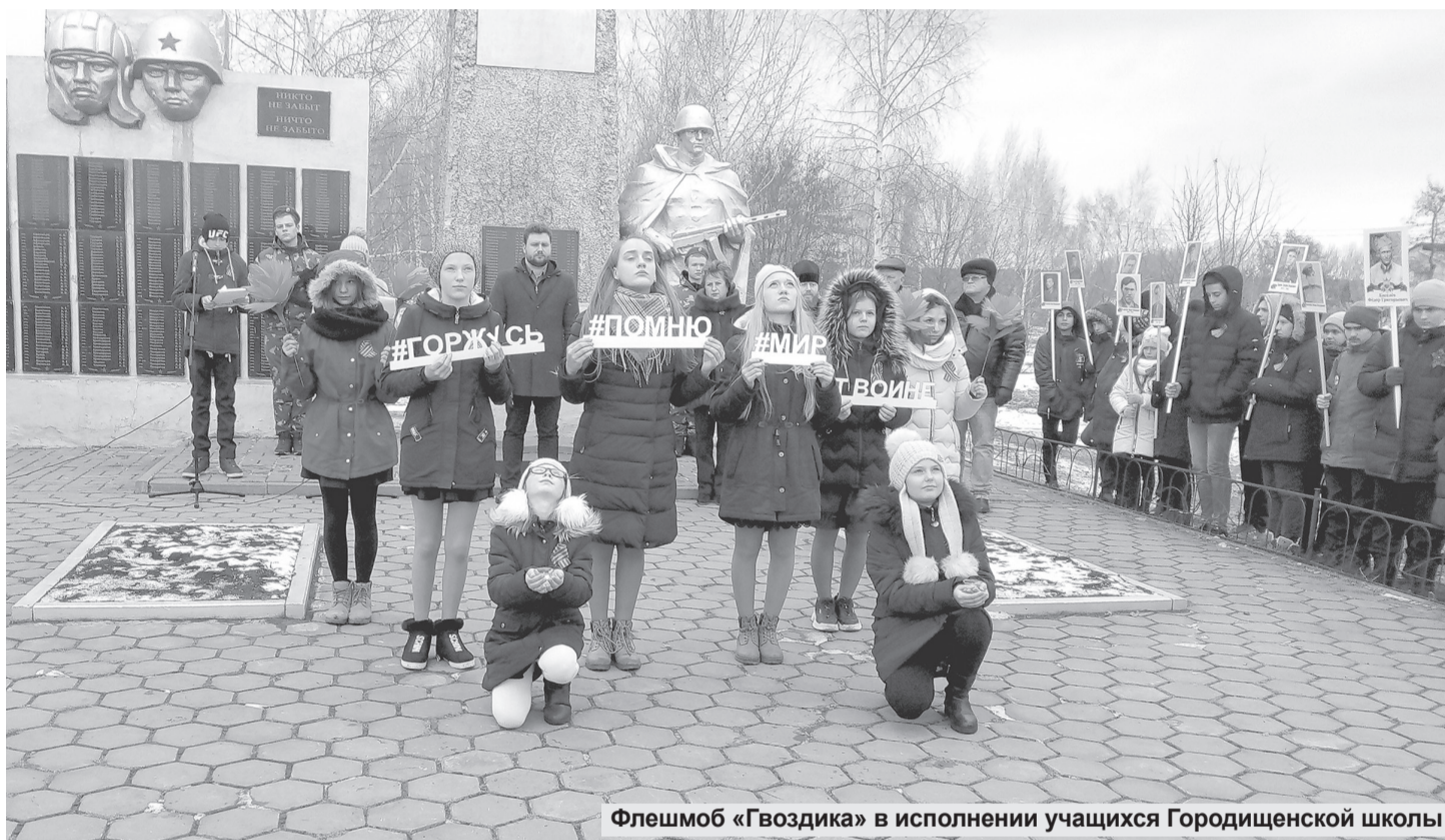
Флешмоб «Гвоздика» в исполнении учащихся Городищенской школы