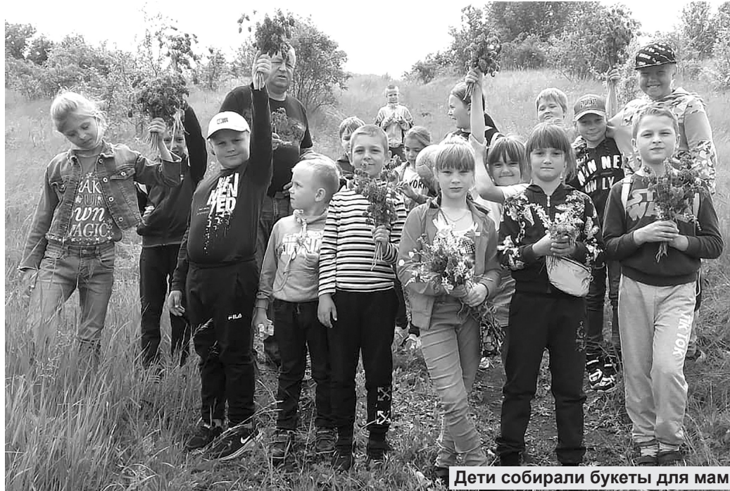
Дети собирали букеты для мам

— Моя сестра Настя учится с Дашей в одном классе. Все вместе отдыхаем в лагере, каждый день играем. Ездили на экскурсию в зоо-