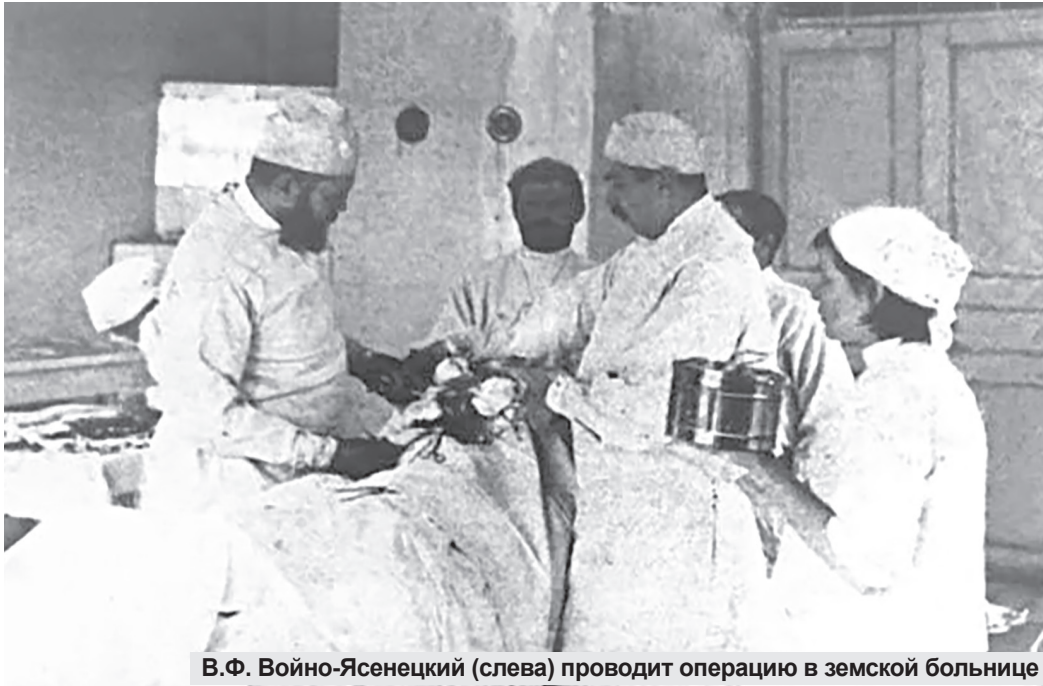
В.Ф. Войно-Ясенецкий (слева) проводит операцию в земской больнице