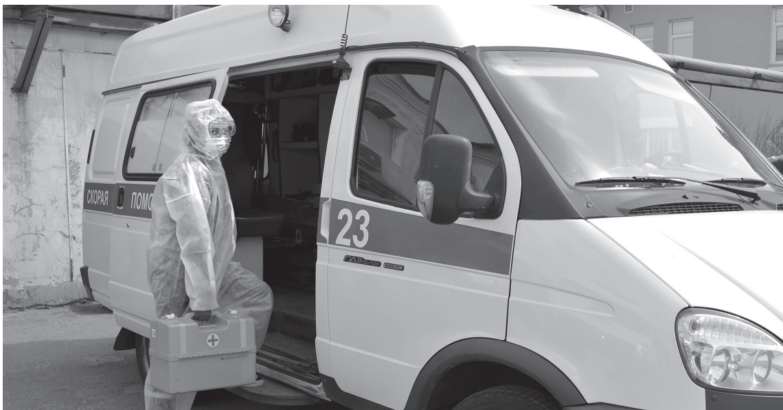
Нелёгкие будни «скорой помощи»

Как работают медики «скорой помощи» в эти дни