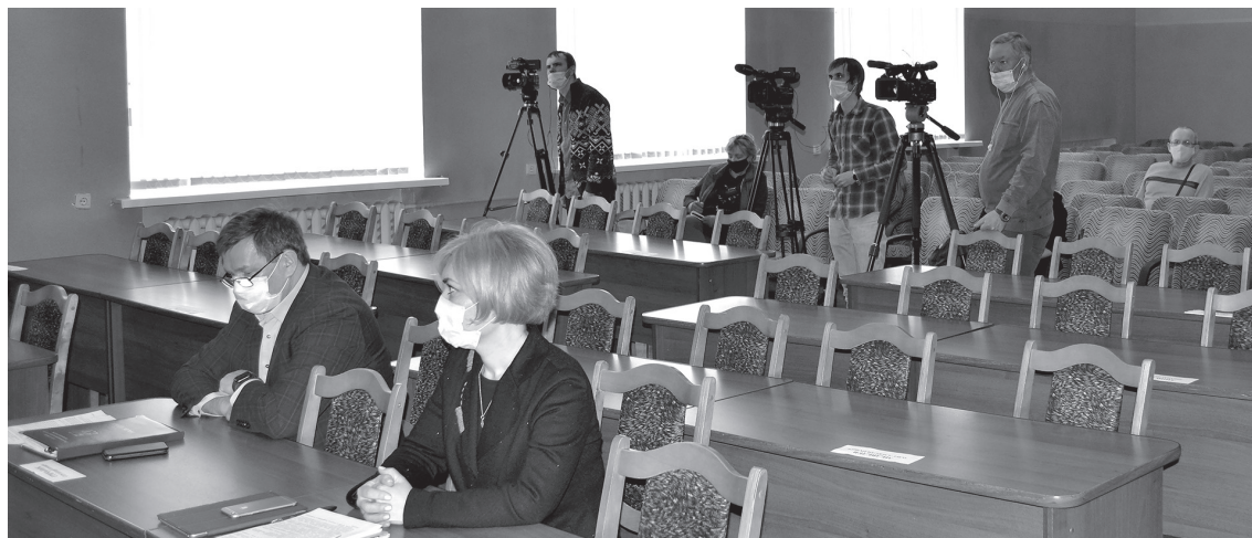
☑ Все участники брифинга были в защитных масках