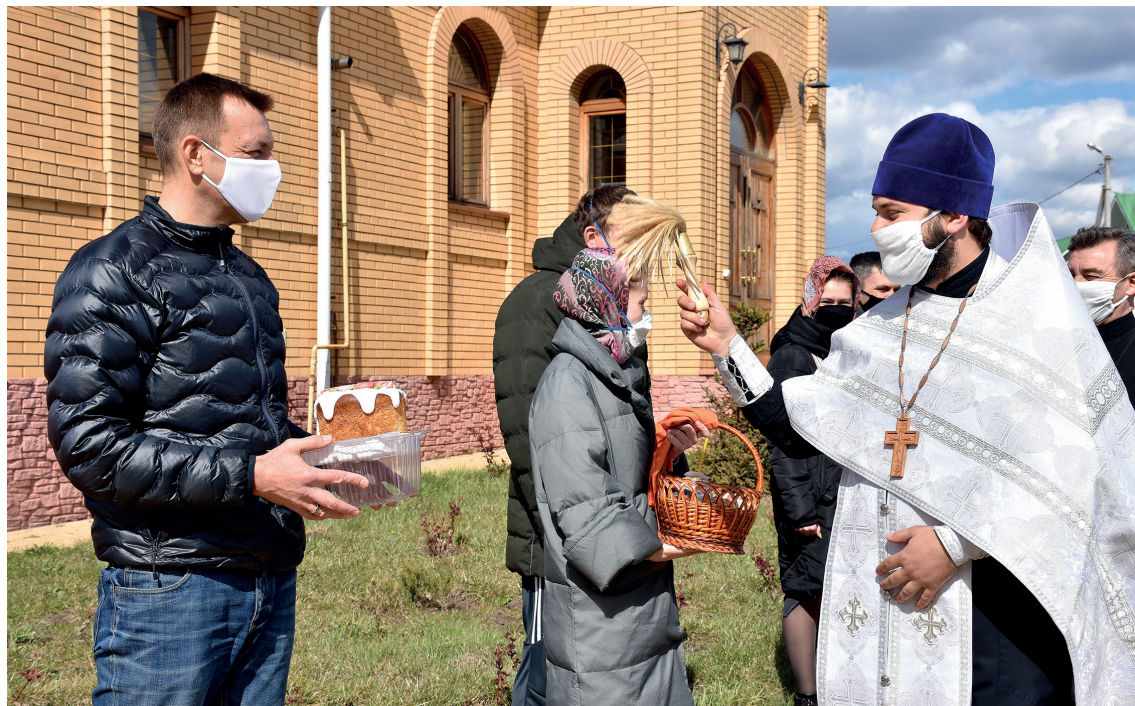
Освящение куличей

Накануне праздника многодетным семьям вручили главный пасхальный символ