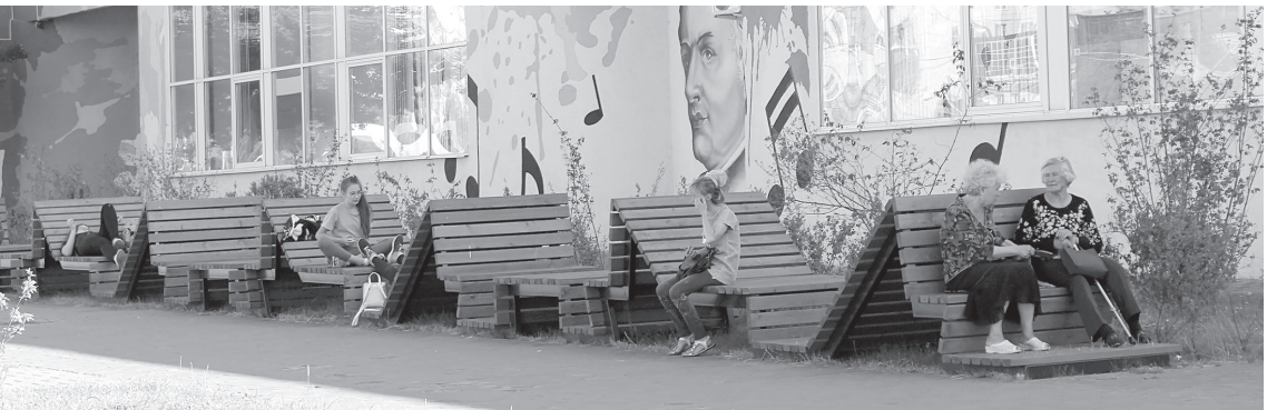
Пергола и лавочка у музыкальной школы № 5