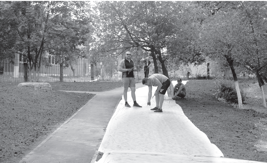
Идёт работа на Студенческом