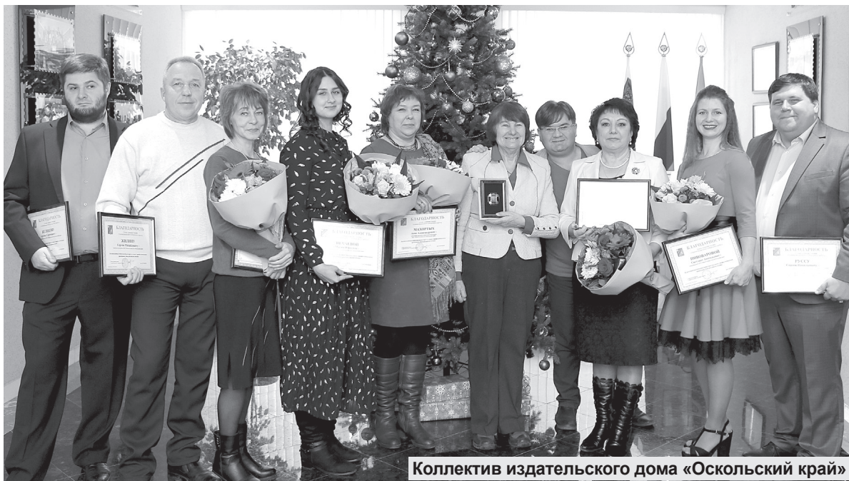
Коллектив издательского дома «Оскольский край»

Торжественное собрание, посвящённое Дню российской печати, состоялось 13 января в большом зале администрации Старооскольского городского округа.