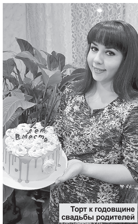
Торт к годовщине свадьбы родителей