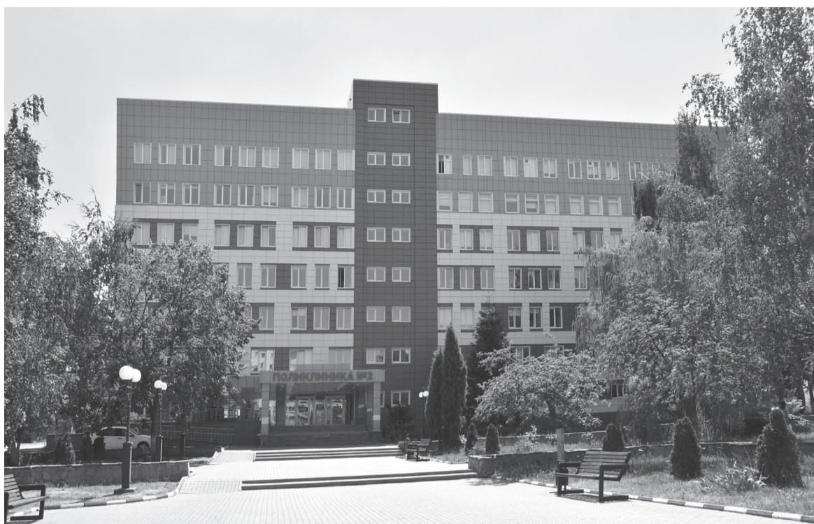
Отремонтированное здание поликлиники

В ходе реализации регионального проекта «Управление здоровьем» в 2,5 раза увеличилось количество сельских врачебных амбулаторий, все объекты оснащены оборудованием в полном объёме, реализована сельская модель взаимодействия врачей общей практики с врачами-педиатрами. Значимыми результатами стали: снижение в 1,5 раза случаев временной нетрудоспособности работающего населения; снижение уровня общей заболеваемости детей и подростков на 5,5 %; повышение количества детей с 1 группой здоровья на 3 %; увеличенные доли посещений детьми и под-