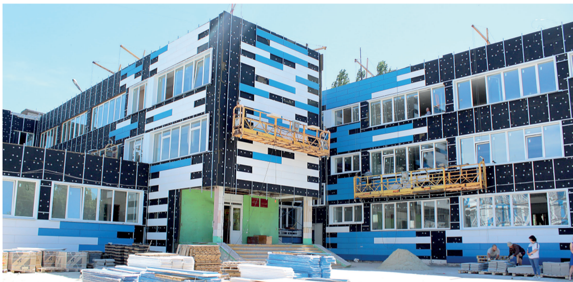
В школе № 15 ремонт в полном разгаре

Идёт капремонт учреждений образования, культуры и здравоохранения на средства Андрея Скоча