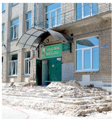
Школа № 8 свой юбилей встретит обновлённой