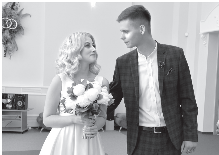
📷 Уже семья