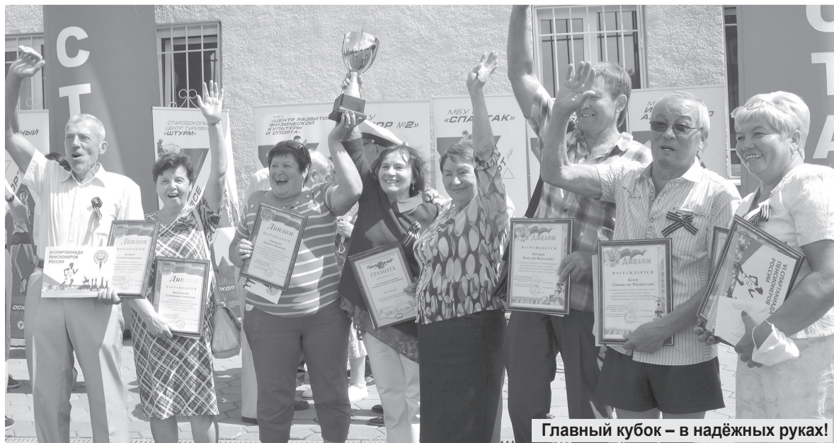
Главный кубок – в надёжных руках!