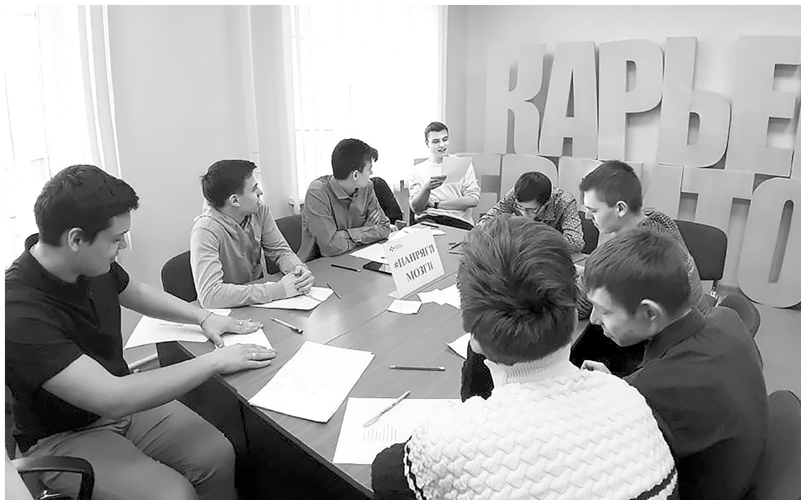
■ Тренинг «Мой путь к успеху»

Сервис 2 «Предпенсионный возраст – возраст начала новой жизни». Окажем помощь в составлении резюме, профиля квалификации, психологическую